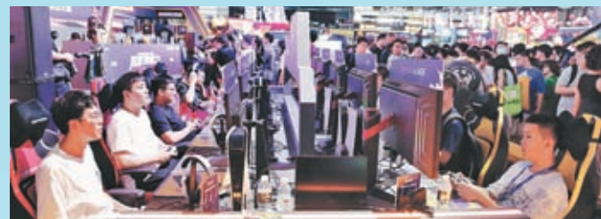
◆中國企業近年將目光投向價值1,900億美元的全球電子遊戲市場。網上圖片

日本知名遊戲開發商 Grasshopper 於2021年加入網易公司，開發商辦人須田剛一形容，在中國企業支持下，日本團隊獲得更舒適的工作環境，人手也更充裕。《如龍》系列遊戲總製作人名越稔洋在網易協助下，準備開發面向全球玩家的電腦遊戲，「只要遊戲對市場有吸引力，玩家也愈來愈不會關注誰製作遊戲、製作人來自哪個國家。」