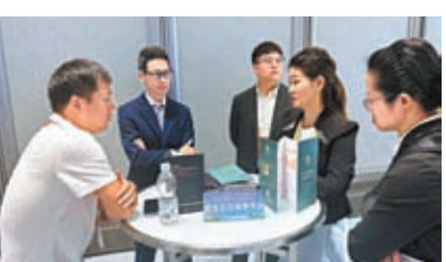
◆推介會上政企對接。