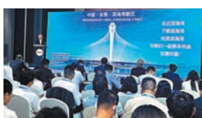
◆大灣區各地市和重大平台紛紛在大會上推介。香港文匯報記者敖敏輝攝