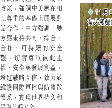
◆11月8日，在美國華盛頓史密森學會國家動物園，裝有大熊貓的箱子準備被運往機場。新華社

香港文匯報訊（記者 姬文風）國際高等教育機構QS 8日公布2024年度亞洲大學排名榜，北京大學連續兩年蟬聯榜首。香港有5所大學打入前25名，其中，香港大學從對上一屆排第四位，躍升至今屆亞洲第二位，為近十年來首次打敗新加坡國立大學。 在榜單前列大學中，清華大學及新加坡南洋理工大學並列第四位。第六位至第十位的亞洲學府依次是中國內地的浙江大學及復旦大學，韓國的延世大學和高麗大學，以及香港中文大學。 論文引用次數 港科大第一 最新的QS亞洲大學排名根據全球認可度、研究實力、教學資源和國際化程度對院校進行評估，有來自25個國家和地區的856所院校參與，香港共有10所大學參加評估。 QS表示，今屆亞洲大學排名是有史以來規模最大的一