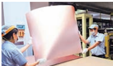
◆台光電子公司員工正在製作材料。資料圖片

「以前我們在大灣區沒有據點，這是我們在大灣區的第一個項目。在收購和項目實施過程中，大灣區給到了非常好的政策。我們同時在香港有團隊，將透過香港布局全球，這是我們的重要路徑。」劉曉說。