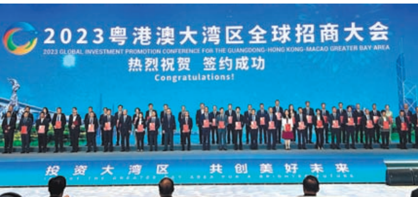
◆2023粵港澳大灣區全球招商大會共達成投資貿易項目859個，總金額超2.24萬億元人民幣。圖為重大項目簽約現場。

香港文匯報訊（綜合新華社和記者敖敏輝 報道）由廣東省政府與香港、澳門特別行政區政府聯合主辦的2023粵港澳大灣區全球招商大會8日在廣州舉行。此次盛會吸引了來自美國、英國、德國、法國等數十個國家及地區的世界500強企業、專業機構及商協會代表等參會。繼去年首屆大會簽約2.5萬億元（除特別標明外，貨幣單位為人民幣）後，本屆大會再取得豐碩成果，共達成投資貿易項目859個，總金額超2.24萬億元，一大批高新技術項目、總部型項目和研發創新中心簽約落戶。