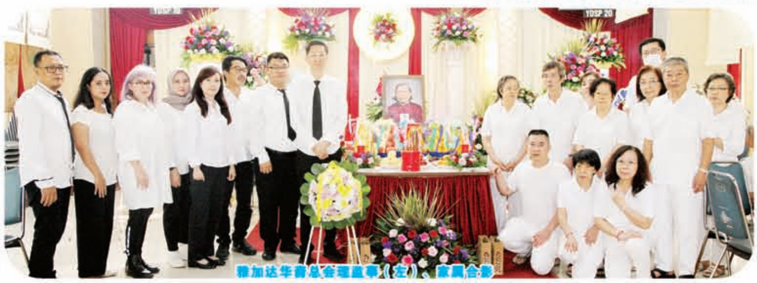
雅加达华裔总会理监事(左)、家属合影