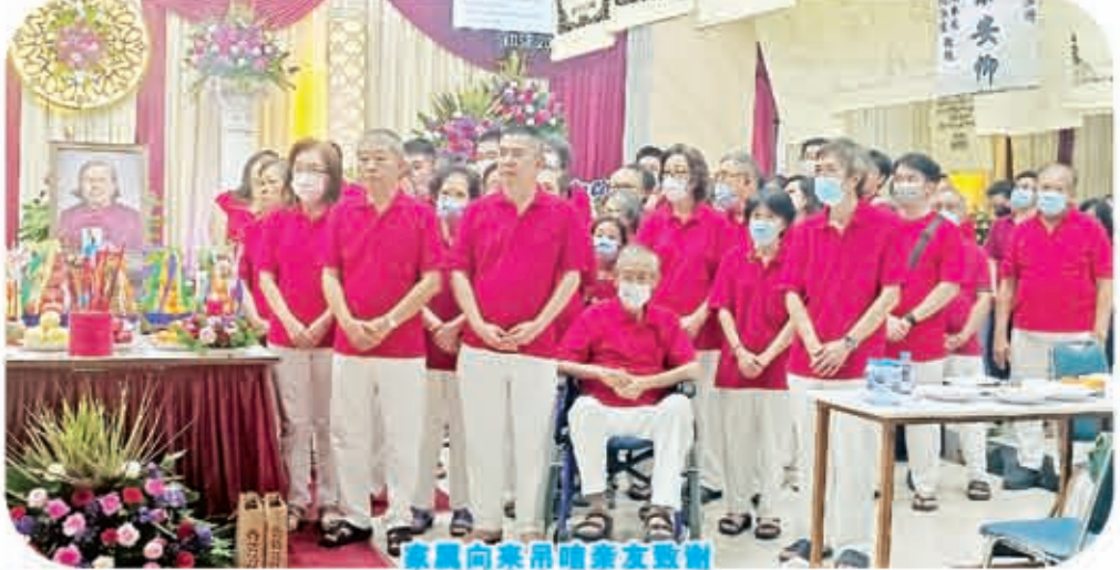
家属向灵前唱诵支支哀歌