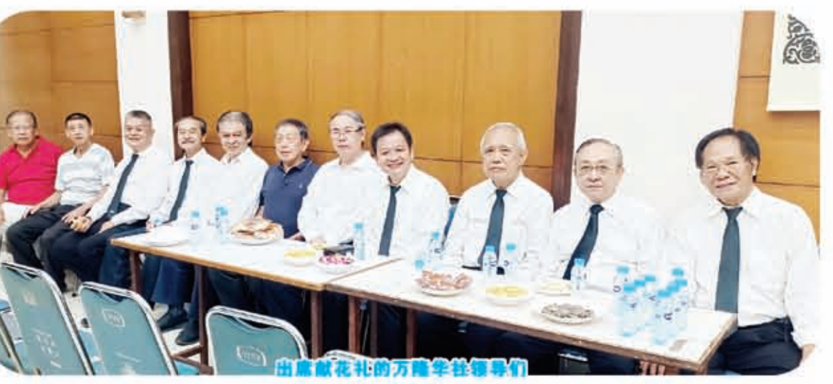
出席献花礼的万隆华裔总会领导