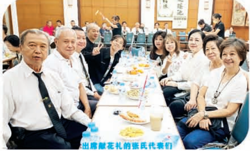
出席献花礼的张氏代表们