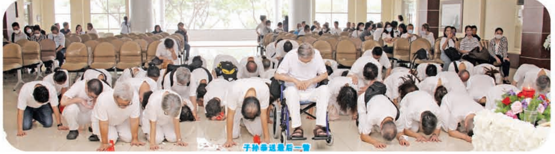
子孙参送最后一哩