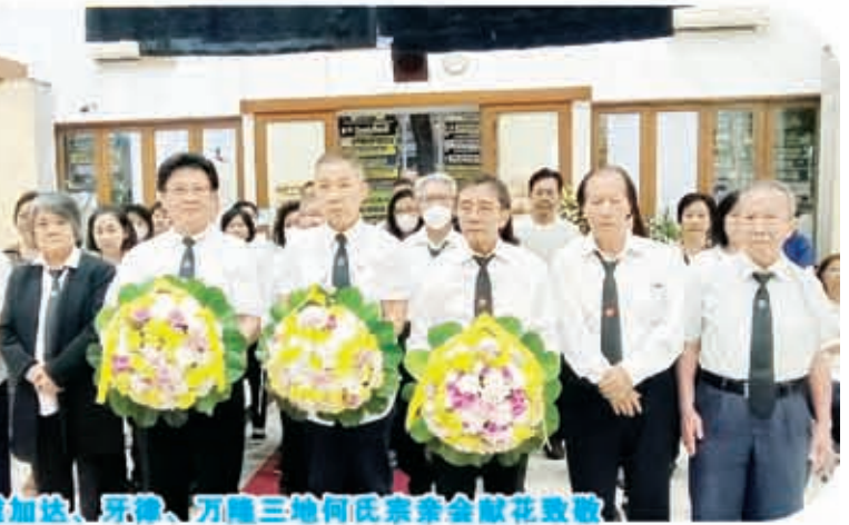
雅加达、牙律、万隆三地何氏宗亲会献花致敬