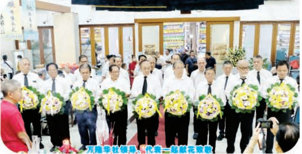
万隆华裔总会、代表一起献花致敬