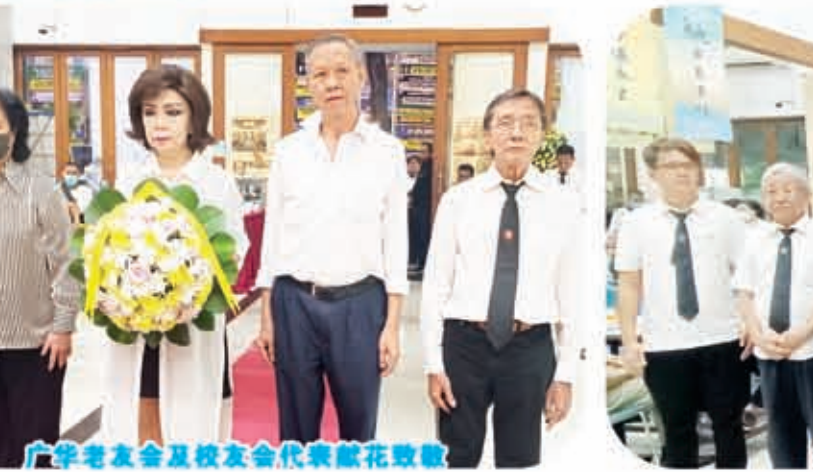
广华老友会及校友会代表献花致敬