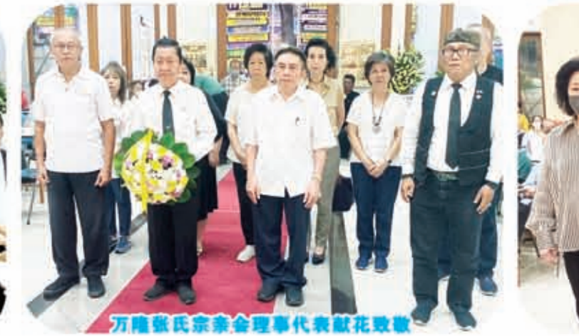
万隆张氏宗亲会理监事代表献花致敬