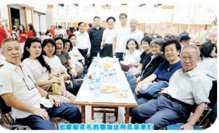
出席献花礼的雅加达何氏宗亲会