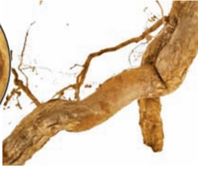
◆鈎吻的根表面呈灰棕色或棕色。