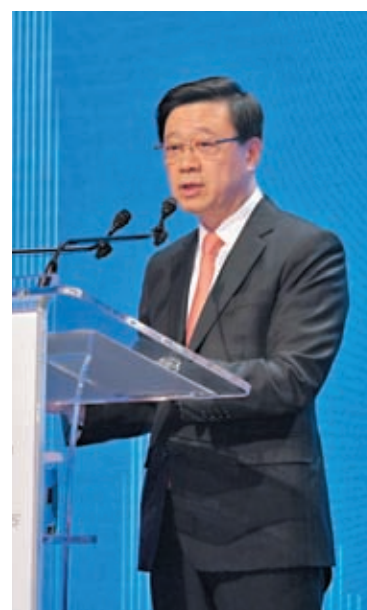
◆李家超7日在峰會致辭時表示，今年香港已處於世界舞台中心，為商業、金融和投資創造機會。

香港文匯報訊（記者 曾業俊）香港特區行政長官李家超7日在峰會致辭時表示，今日的世界比以往任何時候都更加複雜和具挑戰性，香港是自由開放的經濟體，很難不受全球經濟逆風影響；惟香港在「一國兩制」架構下，實施與全球許多主要金融中心一樣的普通法，是中國唯一的普通法司法管轄區，加上香港是內地與國際市場之間的門戶和全球資金流動的渠道，增強了香港作為國際金融中心的獨特優勢。