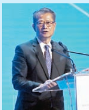
◆陳茂波表示，大灣區商機處處，香港已在人才和基建等方面作大量投資。香港文匯報記者郭木又 攝

香港文匯報訊（記者 周紹基）香港經濟正穩步復甦，為了讓經濟提速，特區政府正積極引進更多企業投資和人才。特區政府財政司司長陳茂波7日在峰會預期，今年香港經濟增長將高於3%，增速較政府所希望的慢一點，但經濟復甦動力正在持續。未來10年將大力發展本地基建，也加大力度拓展與大灣區的運輸基建，呼籲在座金融領袖把握投資機會。