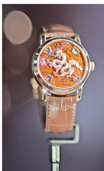
历峰集团展厅展出的江诗丹顿腕表表盘有手工雕刻的生肖“龙”。

西班牙大米云谷跨境售后总监詹青为中国“出海”品牌提供跨境售后服务,是进博会的“头回客”。詹青说:“参加进博会帮助我们集中、快速接触大量乐于拓展跨国业务、推进国际合作的