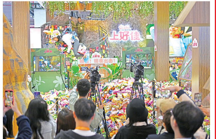
食品及农产品展区侨企“上好佳”展台的互动游戏吸引观众围观。

点和具体需求,为我们的业务拓展带来切实便利。更重要的是,进博会能够拓展视野,让我们看到全世界最前沿、最能代