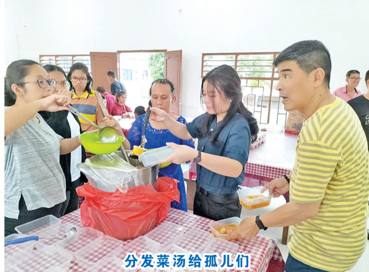
分发菜汤给孤儿们