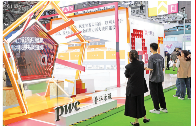
11月6日,参观者在普华永道展台旁聆听发布会内容。中新社记者 盛佳鹏 摄

“我们已入驻进博会‘6天+365天’常年展示交易平台侨联专区,相信非洲将和中国继续加强合作,共同推动进博会和‘一带一路’倡议的发展,为全球贸易和经济发展作出更大贡献。” 新西兰联合贸易发展有限公司联合创始人徐凌是首届进博会的参展商,再次回到进博会,他看到了摩肩接踵的人流和火热喧闹的会场,在各大展厅不仅见到了老朋友,还结识了许多新伙伴和他们带来的新产品——来自南非的腰果和茶、来自新西兰的牛羊肉和保健品、来自阿富汗的松子和石榴,还有以金光集团、正大集团等为代表的