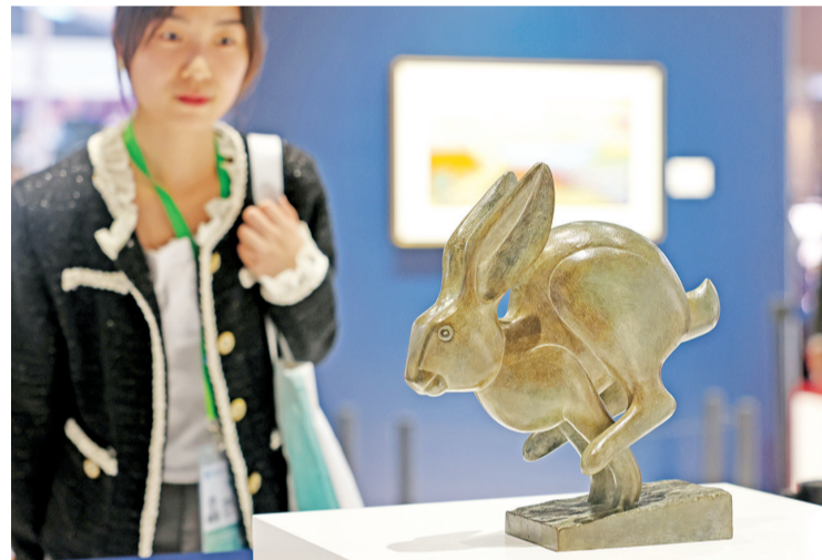
参展商特意选择了艺术家弗朗索瓦以兔子为题材的雕塑作品,参加中国农历癸卯兔年的进博会。