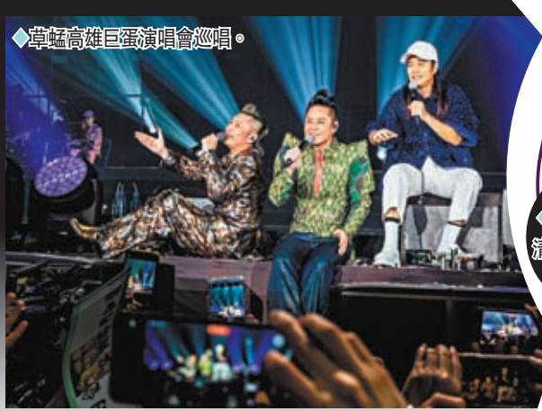
◆草蜢高雄巨蛋演唱會巡唱。