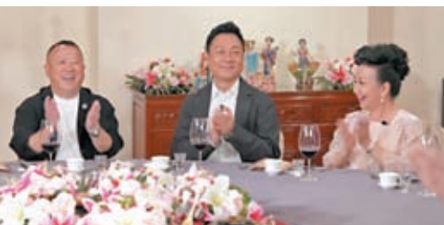
◆祥仔、志偉及家燕姐談起美食眉飛色舞。

香港文匯報訊(記者 梁靜儀) 黎耀祥宴請星級嘉賓「請客必食18道菜」，陳凱琳揭老公鄭嘉穎請客必備一道菜，又爆兒子將燒賣當正餐；顧紀筠以招牌菜交換3隻三頭鮑鮑，薛家燕開心分享少女時代被迫求時的必吃菜式。