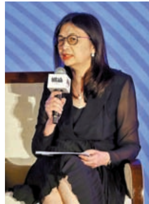
◆證監會行政總裁梁鳳儀指，如果監管問題得到滿足，香港將考慮未來開放散戶投資者參與現貨加密貨幣ETF。

加密貨幣行業認為ETF是令數字資產變得更主流的一種方式，因為投資者可較輕易投資這些基金。此外，比特幣今年累升110%，部分原因正是市場憧憬貝萊德等公司很快可獲批啟動美國首隻比特幣現貨ETF。目前香港和美國均允許基於期貨的加密貨幣ETF，但與基金行業的整體規模相比，其採用率並不高。香港目前上市的有三星比特幣期貨主動型ETF(3135)、南方東英比特幣期貨ETF(3066)，以及南方東英以太幣期貨ETF(3068)，總資產約6,500萬美元。