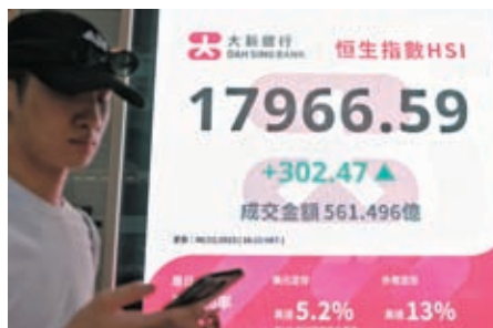
◆GEM指數6日升至22,222點，恒指突破50天線(17,765點)。

香港文匯報訊(記者 周紹基) 港股市場的GEM正經歷低潮期，近3年再沒有新股在GEM上市，GEM指數也較歷史高位暴跌99%，6日收報22,222點，由2007年高峰時高見1,823點一路下沉至雙位數，改革刻不容緩。GEM改革諮詢6日結束，但有業界認為條文仍對中小企不公，仍有改善空間。