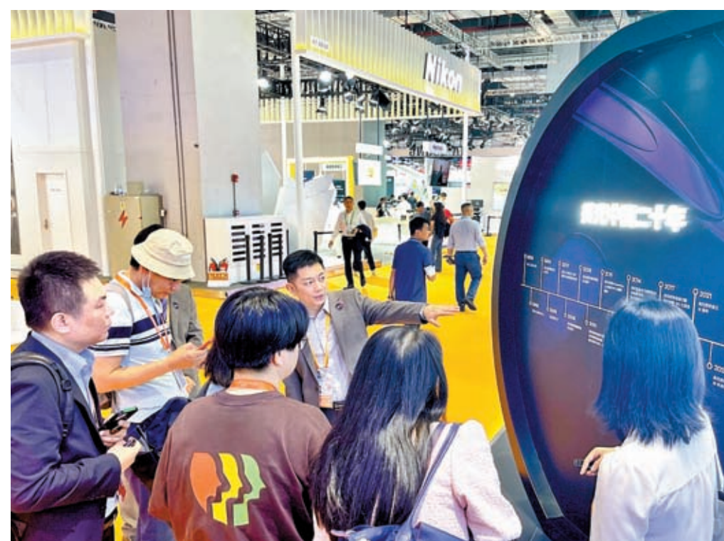
◆美國最大的存儲芯片製造商美光今年首次參加進博會，特設「數字中國」展示區，用行動表達對中國市場的重視。