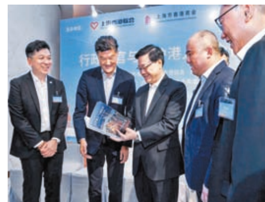
◆李家超在上海訪問期間，在滬港人港企代表姚祖輝（左二）等向他贈送了由大公報出版有限公司出版的《踔厲前行——在滬港人上海故事》一書，受到特首充分肯定。