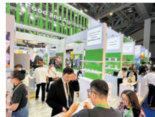
◆農業已成為中美經貿合作一大亮點。圖為美國參展商在本次進博會美國食品與農業館為中國買家介紹商品。

上海美國商會會長鄭藝認為，世界經濟復甦動力不足之際，美國「最強進博參展團」來華，凸顯了中美兩國經貿的「空間感」和「豐富性」，見證了兩個超大經濟體之間的交流加速度。