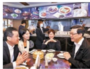
◆10月6日一早，香港特首李家超與幾位同事到上海的一家「百年老店」，一起品嚐具有當地特色的早餐。

「每個故事都是很吸引人。」在姚祖輝看來，記錄、傳播這些在滬港人的奮鬥故事，不僅有益於滬港兩地，