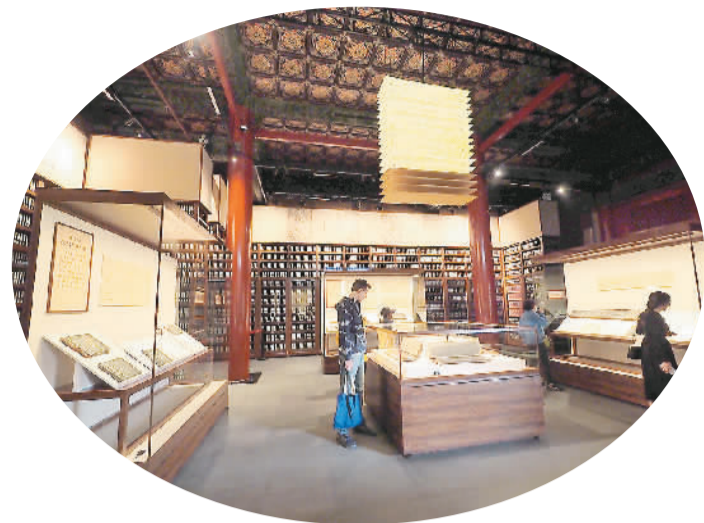
观众在故宫博物院雕版馆内参观。