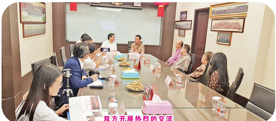
双方开展热烈的交流