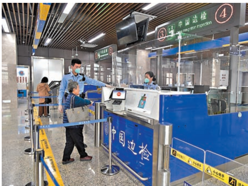
中國出入境管理局研究出台十項出入境政策，並將於2024年1月1日起實施，進一步促進閩台人員往來、便利台胞在閩居住生活，深化兩岸各領域融合發展。圖為搭乘福州連江黃岐—馬祖航線到馬祖的台胞在辦理相關手續。