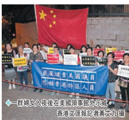
一群婦女入夜後在美國領事館外示威。

香港警務處亦發聲明，警務處處長蕭澤鈞對於有關美國政客的卑劣及無恥手段予以強烈譴責，更指他們的霸凌行為不會得逞，只會令香港警隊更堅定不移、無畏無懼地捍衛香港法治精神，維護國家安全。