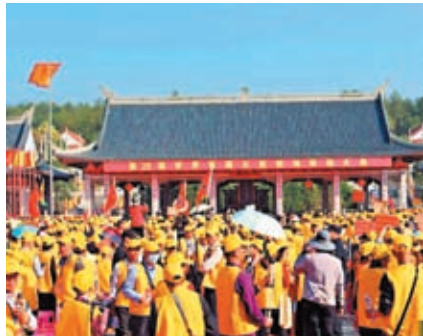
8,000餘名海內外客屬鄉親齊聚石壁客家祖地。

本屆祭祖大典採用「線上+線下」方式同步進行，100多個客屬社團參加現場祭祖大典，其中來自海外的客屬社團17個，來自台灣的客屬社團30個。網絡全程直播祭祀過程，網上觀看達400多萬人次。本屆祭祖大典配套舉辦了豐富多彩的活動，包括寧台客家山歌謠大賽、第11屆石壁客家論壇、第3屆客家武術大賽、第4屆寧台農特產品展銷會、第8屆海峽兩岸客家美食節、首屆客商大會、第3屆海峽兩岸姓氏族譜展示交流會、客家城市聯盟戰略合作簽約儀式、非遺展演等系列活動。