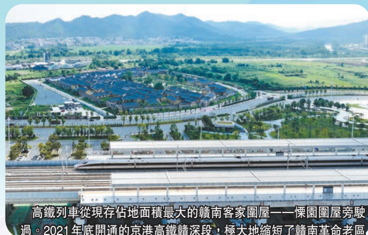
高鐵列車從現存佔地面積最大的贛南客家圍屋——傑園圍屋旁駛過。2021年底開通的京港高鐵路深段，極大地縮短了贛南革命老區同粵港澳大灣區的時空距離，助力「灣區+老區」聯動發展。