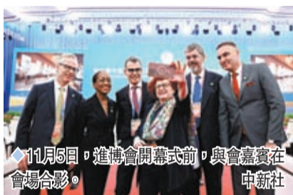
11月5日，進博會開幕式前，與會嘉賓在會場合影。

「一帶一路」建設，堅定支持自由貿易，支持世界貿易組織發揮權威作用，促進貿易投資自由化便利化，維護國際產業鏈供應鏈穩定暢通，實現世界包容可持續發展。開幕式前，李強參觀了企業展。開幕式後，李強同與會外國領導人共同巡館。何立峰、陳吉寧、吳政隆參加上述活動。