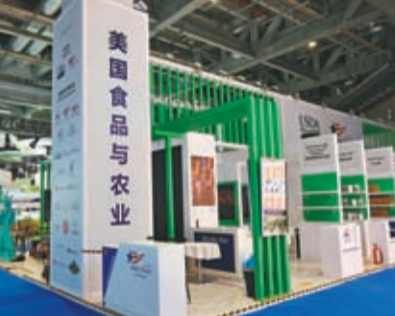
11月4日，美國食品與農業展位布置有序、靜待開幕。

半年多來，中美雙邊關係企穩回升，多領域都有了較好的交流。美國聯邦政府層面參與進博會是一個非常積極的信號，表明美方有強烈的意願擴大對華農產品出口，也進一步表明了美方對中方正向發展的態度。