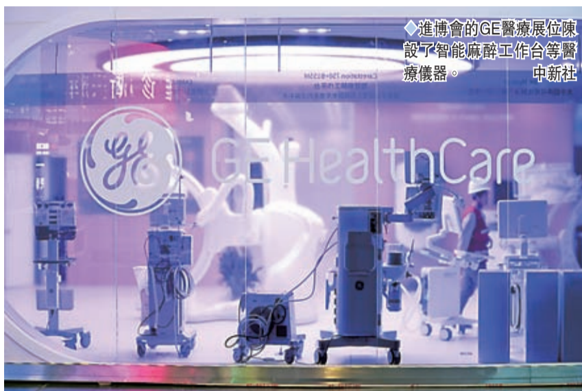
進博會的GE醫療展位陳設了智能麻醉工作平台等醫療儀器。