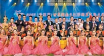
11月3日，2023世界閩南文化節在菲律賓馬尼拉舉行開幕式。

香港文匯報訊 據新華社報道，由泉州市委宣傳部、菲華各界聯合會等共同主辦的2023世界閩南文化節3日在馬尼拉舉行開幕式。來自印尼、泰國、馬來西亞、美國、日本等國和中國台灣的嘉賓和專家及菲華各社團代表500餘人出席活動。