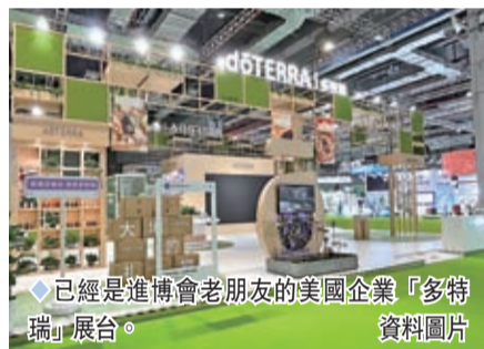
已經是進博會老朋友的美國企業「多特瑞」展台。