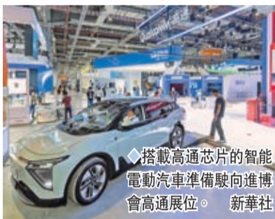
搭載高通芯片的智能電動汽車準備向進博會高通展位。