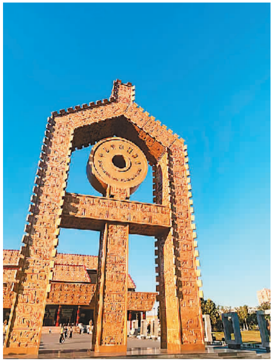
▲中国文字博物馆外观。

科，将学术研究与人的发展、产业发展、地方发展结合起来，打造了一个具有中国特色、国际视野的中外文化交流平台。