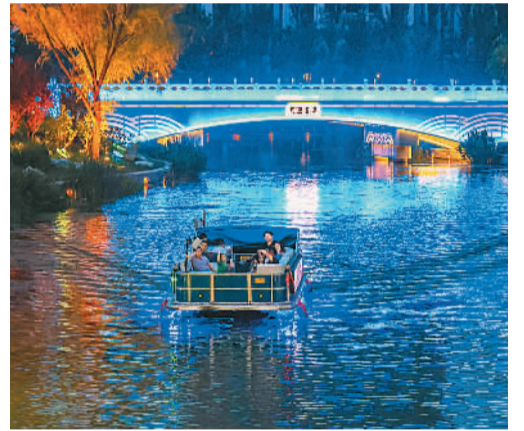
▲亮马河国际风情水岸夜景。

亮马河国际风情水岸项目二期航线共6公里，使用5G、数字光影、VR等前沿科技，以游船串联起亮马河至红领巾公园水域的1河、2湖、24桥、18景。