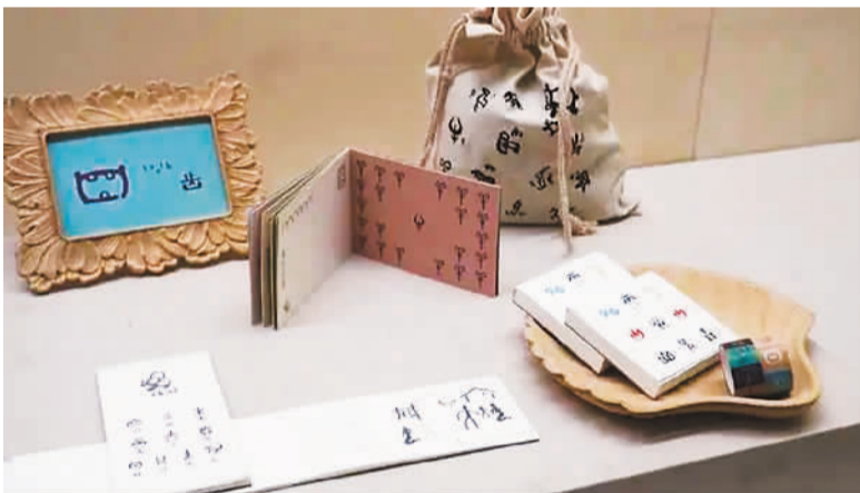
▲2023中国国际汉字文化创意设计大赛获奖作品。

《杨家将》开创画出了一个从历史中走來却又无比鲜活的杨六郎，他的大无畏精神，让忠孝仁义与家国情怀同频共振，让以爱国主义为核心的民族精神闪耀时代光彩，为中华民族英雄的动画影像再添一个经典形象，激励广大青少年从英雄身上汲取力量，勇担强国使命。