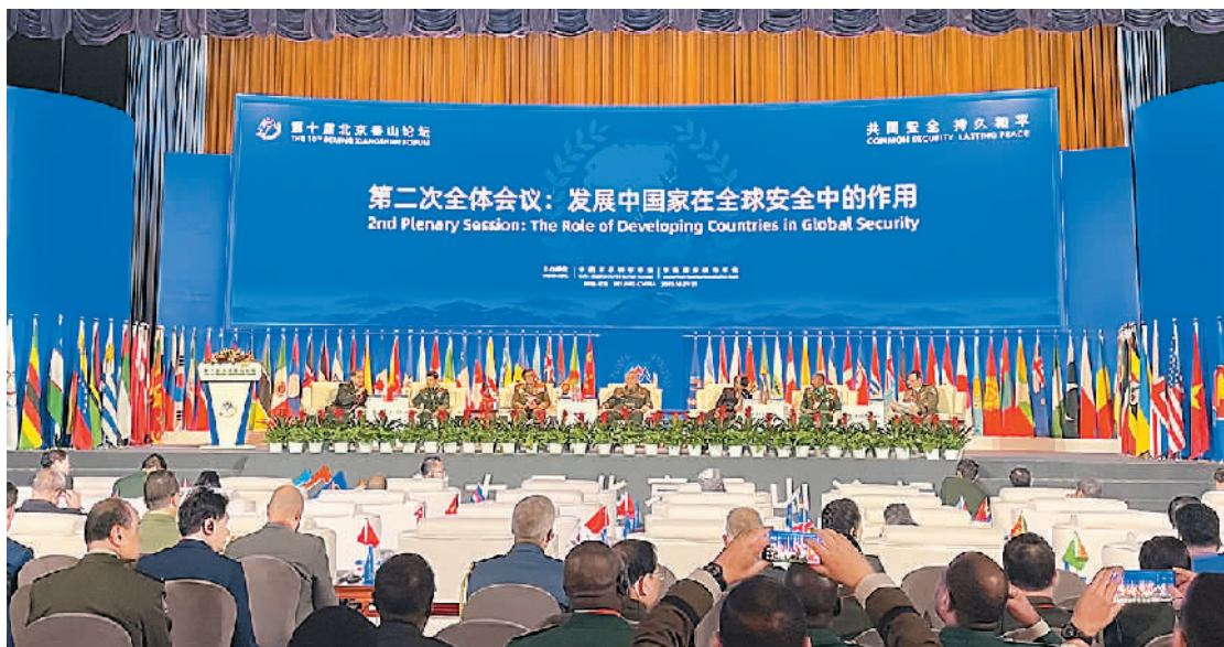
第十届北京香山论坛会场。

近日，第十届北京香山论坛在京举行。本届论坛以“共同安全 持久和平”为主题，共有99个官方代表团、19国国防部长、14国军队总长（国防军司令）、6个国际组织代表及专家学者和各国观察员等1800余名嘉宾出席，参会代表数量和层级创历史新高，特别是发展中国家、国际和地区组织的参与度大幅提升。