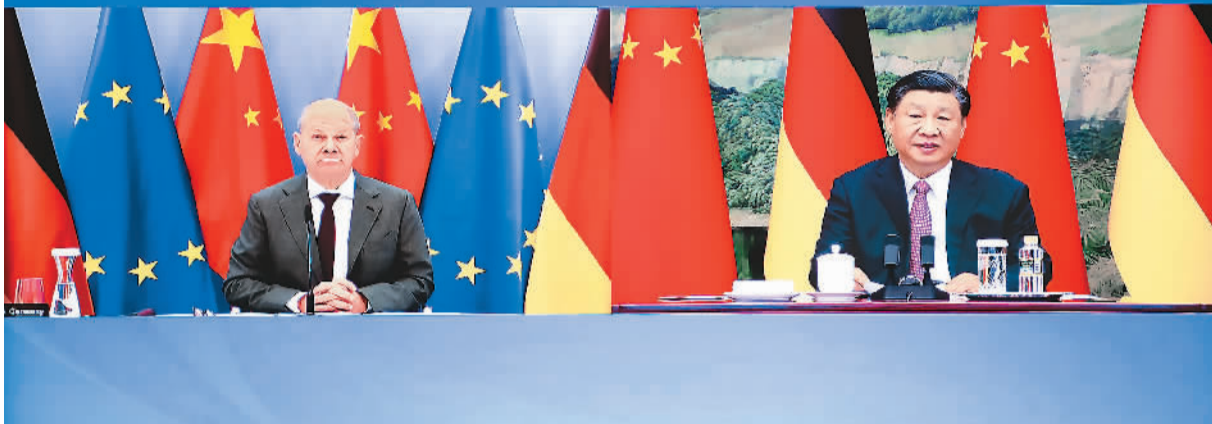
11月3日下午, 国家主席习近平同德国总理朔尔茨举行视频会晤。