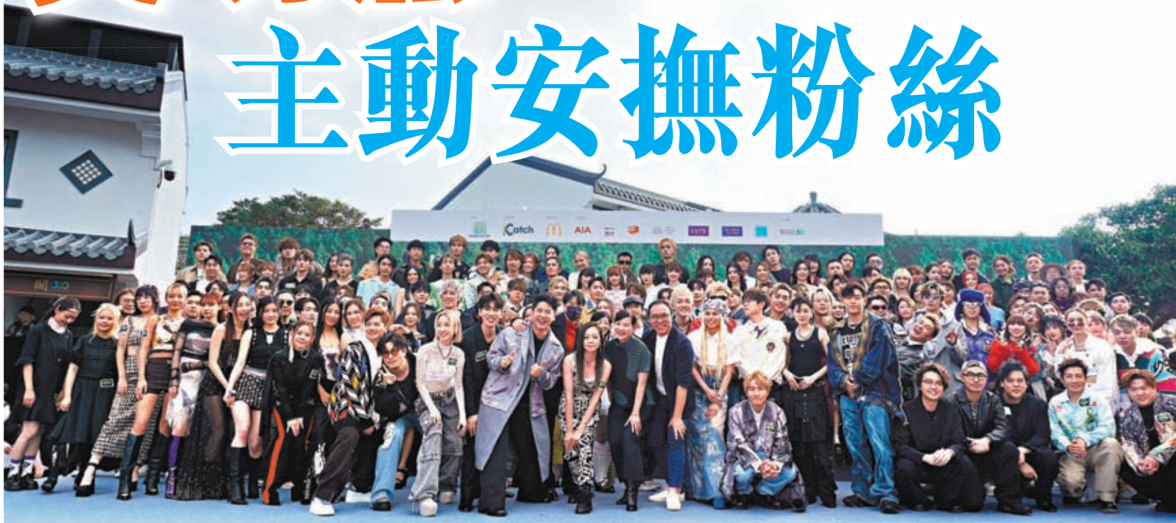
叱咤記招上，近百歌手齊影大合照。