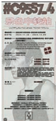
《樂色中轉站》將於26日在長沙開幕。