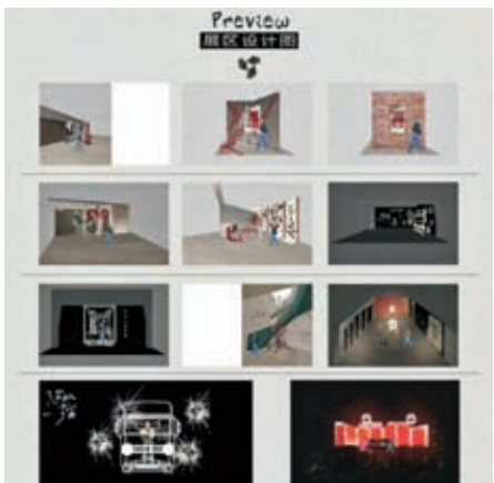
今次展覽細節滿滿。

而粉絲從千璽作品裏衍生出一個藝術展，將對偶像的愛意具象化，這可能就是追星的正向意義所在，偶像與粉絲相互成就，雙向奔赴。