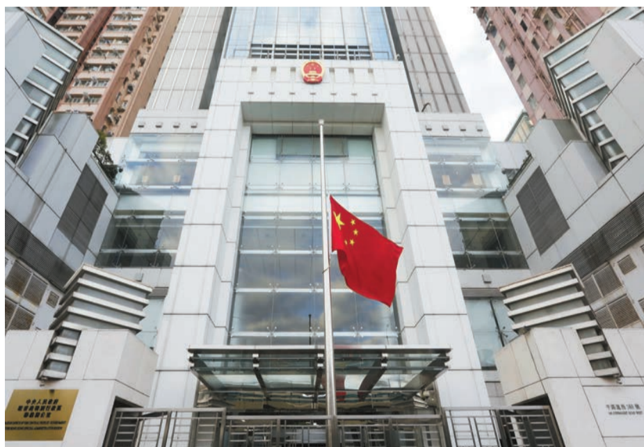
中聯辦下半旗誌哀。