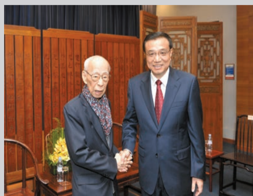
李克強看望國學大師饒宗頤教授。