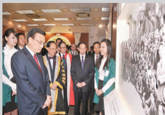
李克強參觀香港大學百年展。