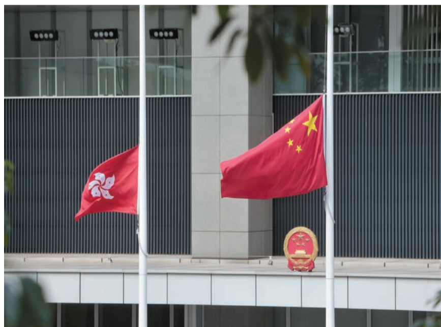
香港特區政府總部下半旗誌哀。