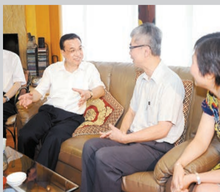
李克強到訪香港家庭。