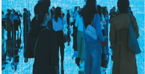
2023年驻华使馆领事官员文旅体验活动现场。

外交部领事司、国家文物局交流合作司、中央广播电视总台国际局以及文化和旅游部部分直属单位、相关文旅企业代表参加活动。