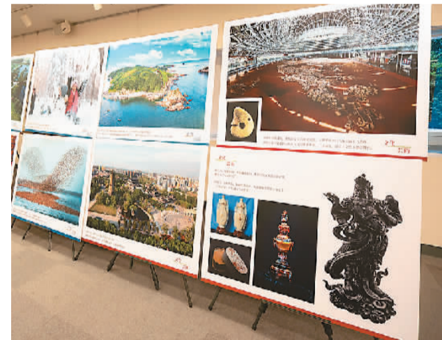
活动现场展出的“山海有情 天辽地宁”活动图片。

日本政府观光局海外推广部副部长桥本佳实结合自身多年前在沈阳长期工作的经历表示，辽宁浓厚的风土人情让其至今难忘。近一段时间以来，中日两国人员往来逐渐