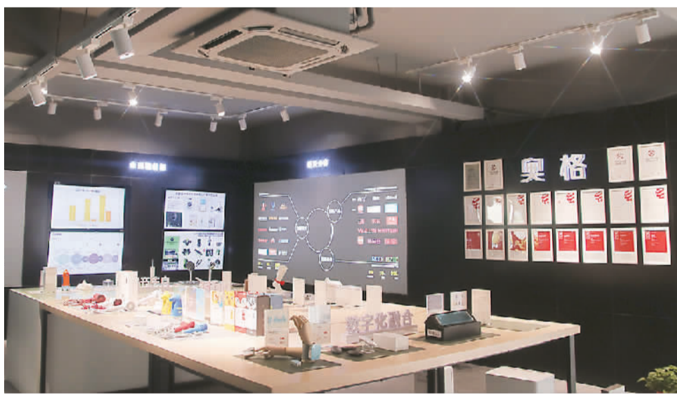
▲ 奥格设计展示厅，设计产品种类涉及小家电、手机配件等。