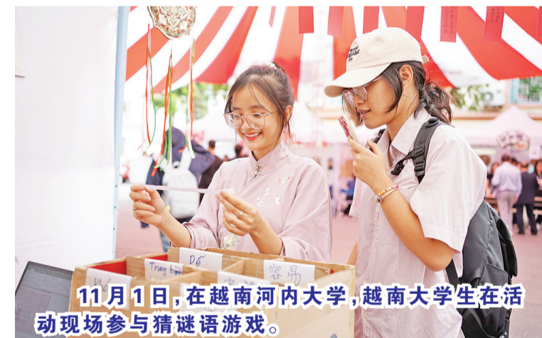
11月1日,在越南河内大学,越南大学生在活动现场参与猜谜语游戏。

【本报讯】联合拖拉机上市公司(PT United Tractors Tbk/UT)不断努力在它所有运营的活动贯彻多元-公平-包容的原则。在这场合中,联合拖拉机鼓舞人心运动会(UT Inspiring Games)与印尼特奥会(SOIna)残疾运动员和国际象棋运动员展开体育赛事。