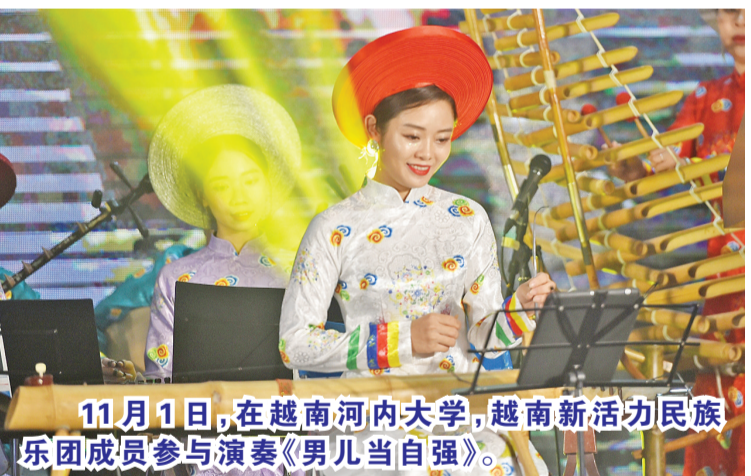
11月1日,在越南河内大学,越南新活力民族乐团成员参与演奏《男儿当自强》。