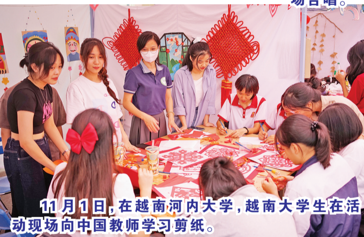
11月1日,在越南河内大学,越南大学生在活动现场向中国教师学习剪纸。