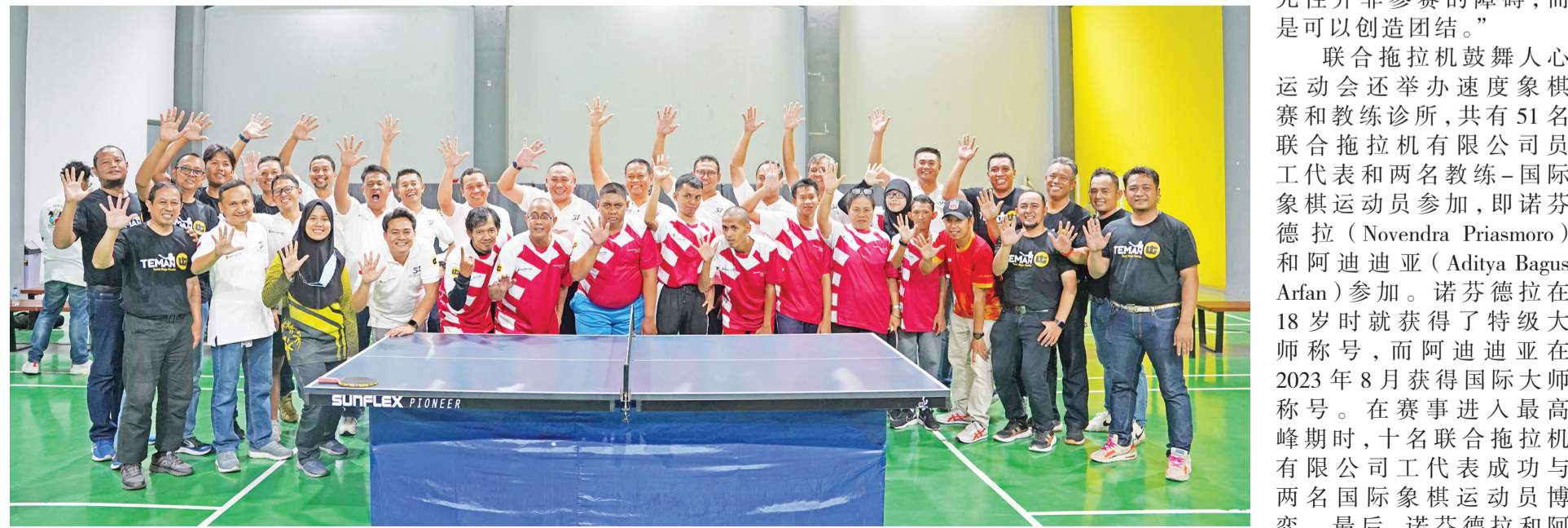
在雅加达联合拖拉机有限公司员工中心举办联合拖拉机有限公司激励人心运动会,参与者有联合拖拉机有限公司高管执行者、员工、印尼特奥会运动员和国际象棋教练运动员参加。

该活动于2023年10月9日在雅加达联合拖拉机有限公司员工中心举行。本次活动也是以体育活动与捐款相结合的方式,迎接联合拖拉机有限公司成立51周年的一系列活动。