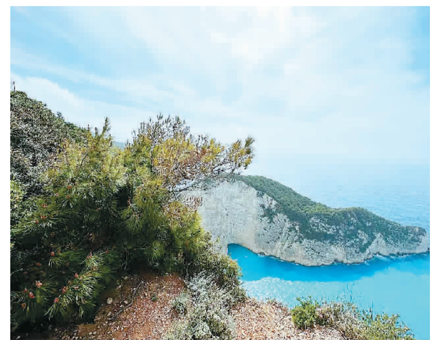
希腊扎金索斯风景。