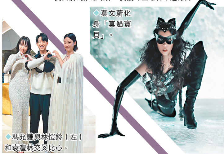
◆ 莫文蔚化身「莫貓寶貝」。