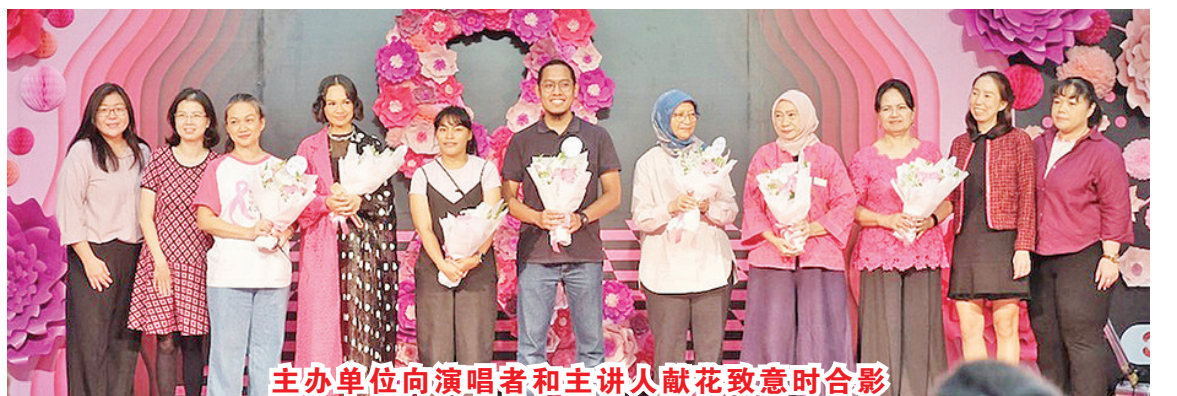
主办单位向演唱者和主讲人献花致意时合影