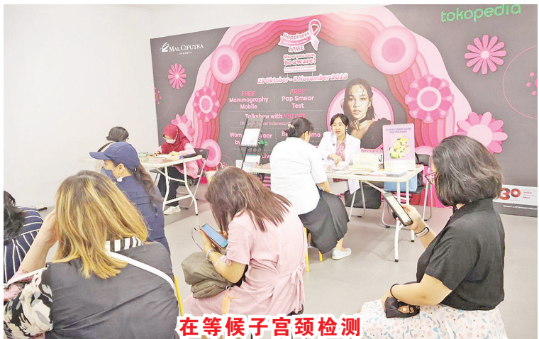
在等候子宫颈检测

另一方面, Tokopedia 希望它能够继续成为印尼商业参与者创造机会并共同帮助实现国民经济平等的平台。 本报记者明光报道/供图