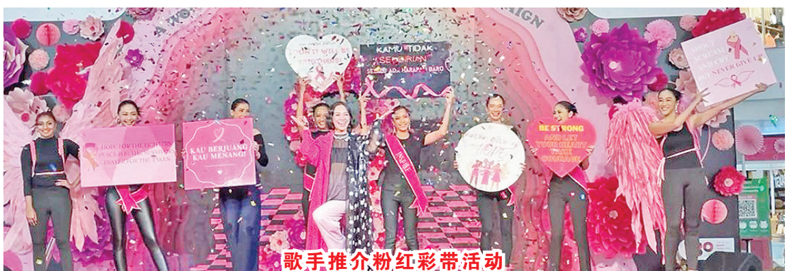
歌手推介粉红彩带活动