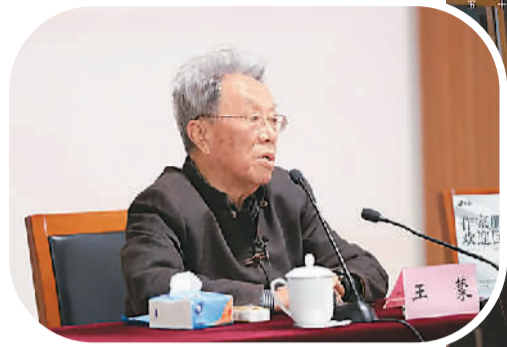
▲王蒙在“春天一堂课”讲座现场。 ▶电视剧《人世间》剧照。

近年来，文学与影视、网络媒介相互介入，跨界融合，不断显现出新的文化活力，开拓出新的意义空间。文学作品的“出圈”、知名作家的“出海”、中国文学的“出海”表现抢眼，这些颇具代表性的文化现象正重新诠释文学与生活的内在关系，在作品与创作者、接受者、消费者以及传播媒介之间建立起新的紧密联系，极大丰富了大众的精神文化生活。