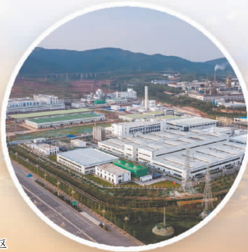
曲靖市新能源电池产业园区