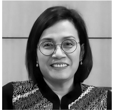
财政部长穆丽亚妮

【本报讯】财政部长穆丽亚妮证实，政府将推出国家预算政策一揽子计划，以减轻厄尔尼诺现象造成的长期干旱的影响。10月27日，穆丽亚妮