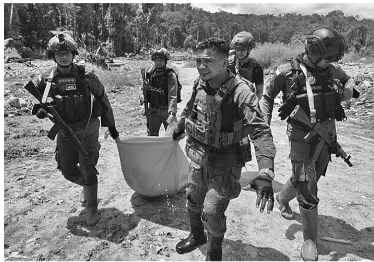
高地巴布亚省亚胡基莫县(Yahukimo)塞拉达拉区(Saradala)发现六具尸体

【本报讯】10月27日，2023年卡滕茨和平行动工作队(Cartenz)声称，在高达巴布亚省亚胡基莫县(Yahukimo)塞拉达拉区(Saradala)发现六具尸体。这六具尸体疑是2023年10月16日在非法矿区发生的武装犯罪集团袭击的受害者的一部分。