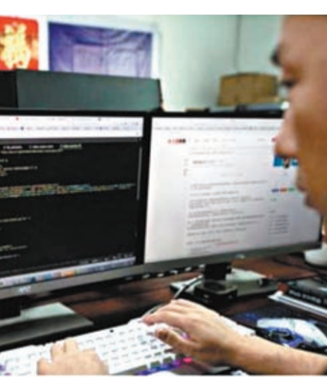
◆中國國家安全部官微提醒，警惕境外SDK背後的「數據間諜」竊密。

2022年4月，有關媒體曝光巴拿馬一家公司通過向世界各地的應用程序開發人員付費的方式，將其SDK代碼整合到應用程序中，秘密地從數百萬台移動設備上收集數據，而該公司與美國情報機構提供網絡情報搜集等服務的國防承包商關係密切。