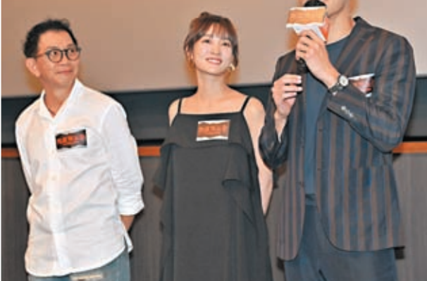
一眾主創齊到戲院謝票，與觀眾合影。