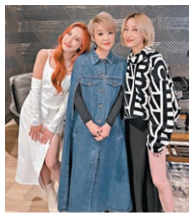
陳慧嫻偕泳兒及許靖韻赴美開騷。

慧嫻又笑指跟Angela合唱《跳舞街》後問對方：「唱完我好好奇佢點解會識唱我嘅歌，始終年紀都差吃幾個generation（時代），哈哈。佢話因為佢小時候父母都成日聽我嘅歌，所以佢對我嘅歌曲都非常熟悉，可以同年輕一輩嘅歌手合作對我嚟講係一件好開心嘅