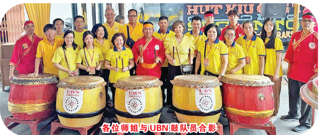
各位师姐与UBN鼓队队员合影