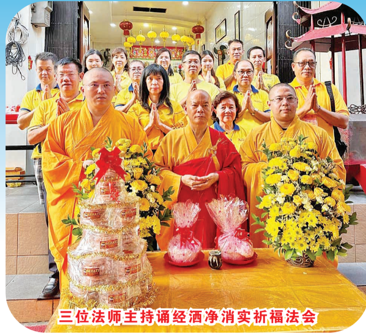
三位法师主持诵经洒净消灾祈福法会