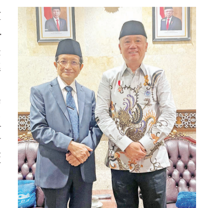
陈荣光总主席与清真寺大伊玛目纳萨鲁丁·奥马尔教授合影