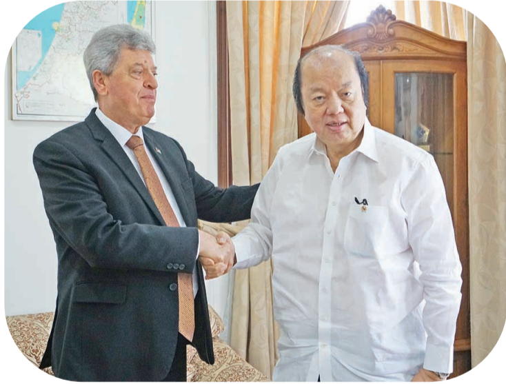
祖海尔·顺大使热烈欢迎翁俊民