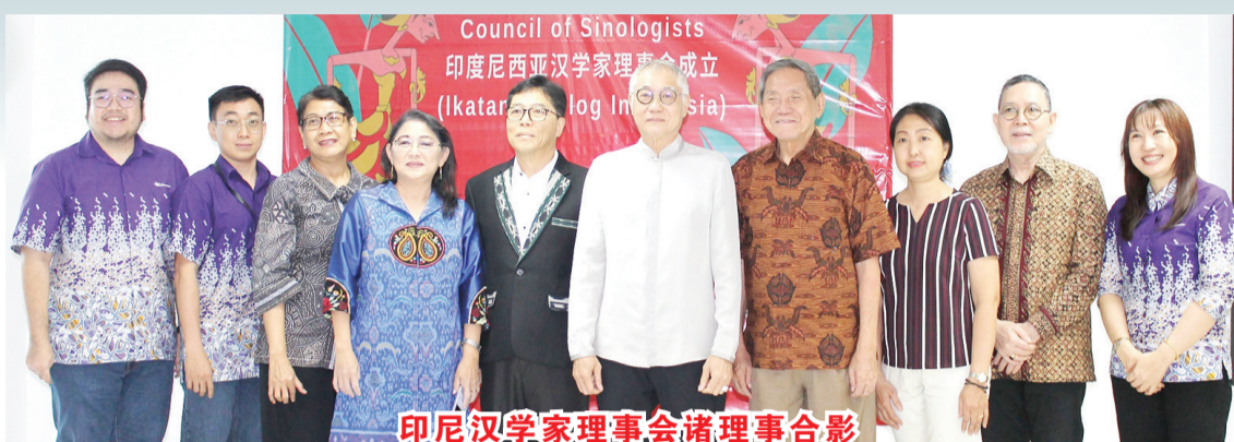
印尼汉学家理事会诸理事合影

此次印尼汉学家理事会的成立，是中印尼两国交流的大事，对推动印尼人民全面认识、了解和理解真实的中国，具有重要的推动作用，对中国人民了解认识印尼同样具有重要意义。希望以本次理事会成立为契机，为加强两国文化交流互鉴、弘扬中印尼世代友好和人文共兴贡献更多智慧和力量。