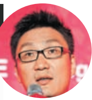
◆黃崢(小圖)是今年胡潤百富榜上排名上升最快的富豪，財富比去年增長1,000億元人民幣。