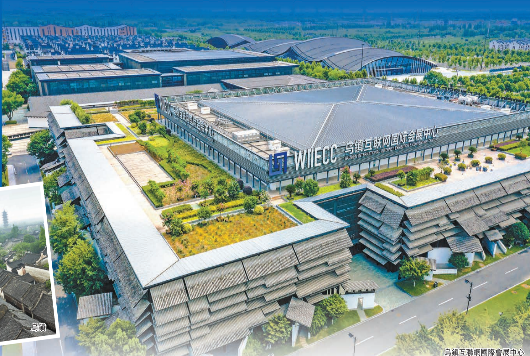
烏鎮互聯網國際會展中心

今年是世界互聯網大會烏鎮峰會舉辦的第十年。十年積澱，作為中國互聯網對話世界的窗口，烏鎮發生了哪些蝶變？峰會為城市發展注入了哪些動能？十年之約，又將會有怎樣的期待？ 郭興超