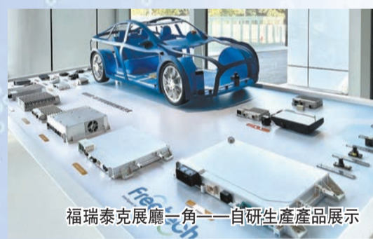
福瑞泰克展廳一角——自研生產產品展示

互聯網總部會展區以世界互聯網大會國際組織浙江辦事處為依託，大力發展國際會展高標態態，積極吸引互聯網頭部企業，打造全球頂尖的互聯網國際交流會展地。今年7月，桐鄉針對會展業出台了重磅優惠政策——「來烏鎮、來桐鄉開會，基礎獎勵補助最高120萬元！」而在10月9日舉行的桐鄉市會展招商推介會上，烏鎮健康大會、烏鎮世界建築博覽會等一大批優質會展項目已落戶烏鎮。