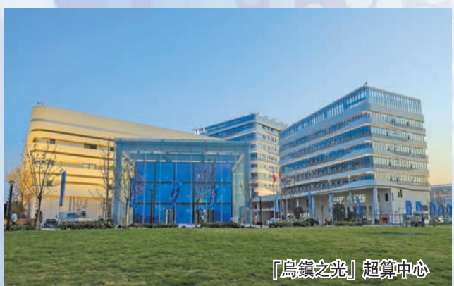
「烏鎮之光」超算中心

企業方面，IBM、高通、思科、英特爾等跨國公司的負責人，以及中國電信、中國聯通、中國移動、三峽集團、阿里、百度、京東、搜狐、網易、360、拼多多、滴滴等國內知名企業負責人均已確認參會。