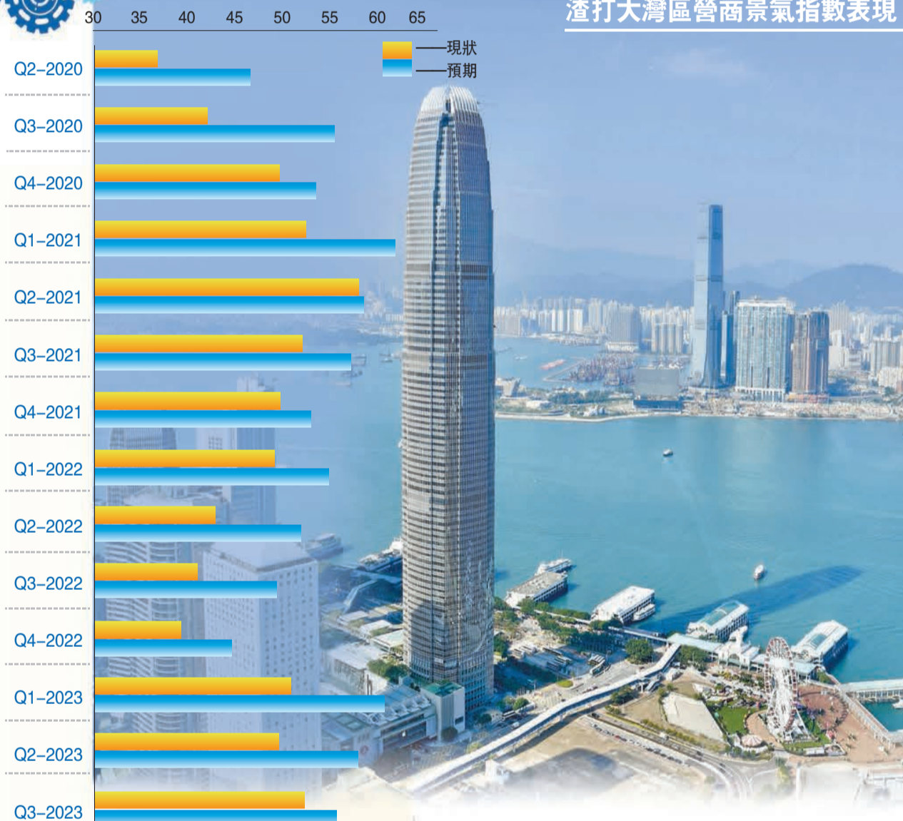
渣打大灣區營商景氣指數（GBAI）第三季報52.9，按季升2.9點，連續兩個季度錄得出乎意料的佳績，反彈速度令人驚喜。

在貨幣政策的傳導效率沒有快速改善的情況下，渣打認為，還有進一步放寬的空間，並估計人民銀行將分別在本季度和明年首季度再次下調中期借貸便利利率，每次10個基點。該行也預計，