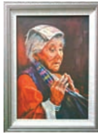
◆自然老去是人生的美。