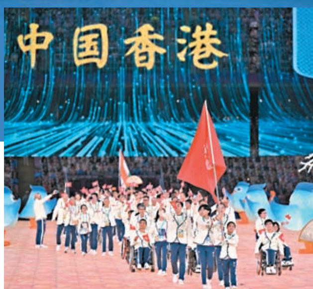
▲中國香港代表團在開幕式上入場。新華社