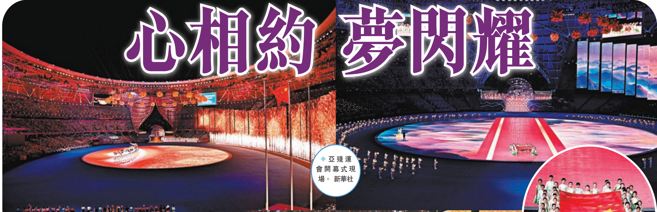
◆亞殘運會開幕式現場。