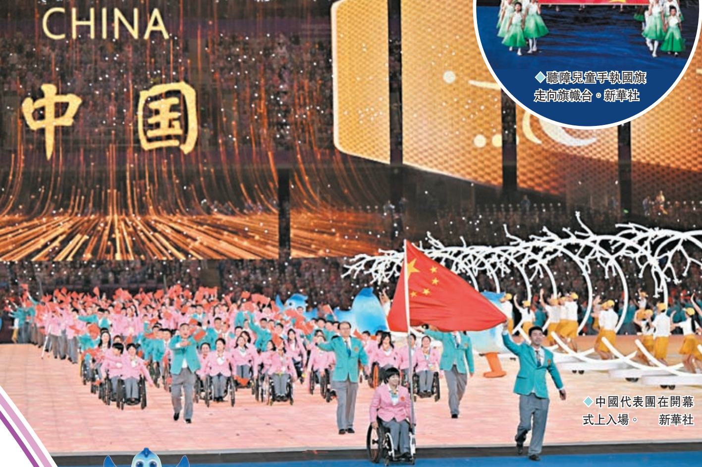
◆中國代表團在開幕式上入場。新華社

▲國務院副總理丁薛祥出席開幕式並宣布第四屆亞殘運會開幕。新華社 杭州第四屆亞洲殘疾人運動會22日晚於杭州奧體中心體育場舉行開幕禮，由中國國務院副總理丁薛祥宣布今屆亞殘運會開幕，並由機械手臂點燃主火炬，而中國香港代表團在持旗手朱文佳及王婷荳的帶領下，排在第七支代表團進場。今次開幕式以「心相約，夢閃耀」為主題，通過《心相約》、《勇向前》、《夢閃耀》三個表演段落，鋪陳出杭州對亞洲的再次誠意相邀，以及展現殘疾人自強不息的精神，體現出「兩個亞運，同樣精彩」。