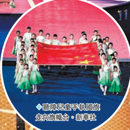
◆聽障兒童手執國旗走向旗幟台。