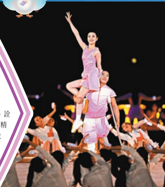
▲開幕式在杭州奧體中心體育場舉行。