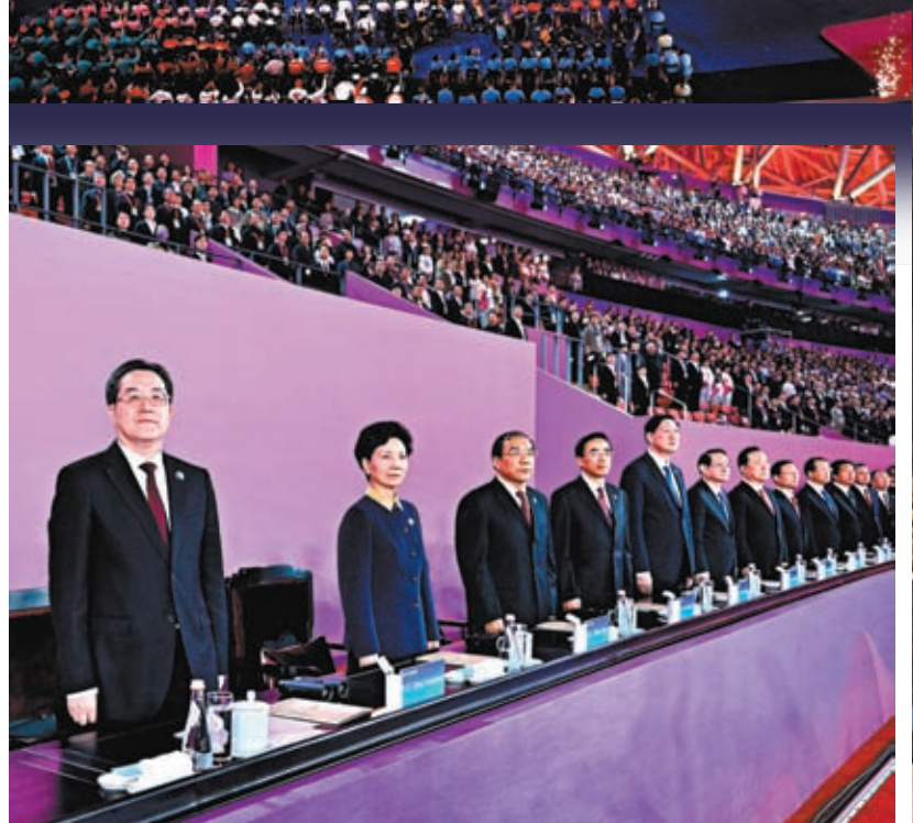
▲國務院副總理丁薛祥出席開幕式並宣布第四屆亞殘運會開幕。新華社