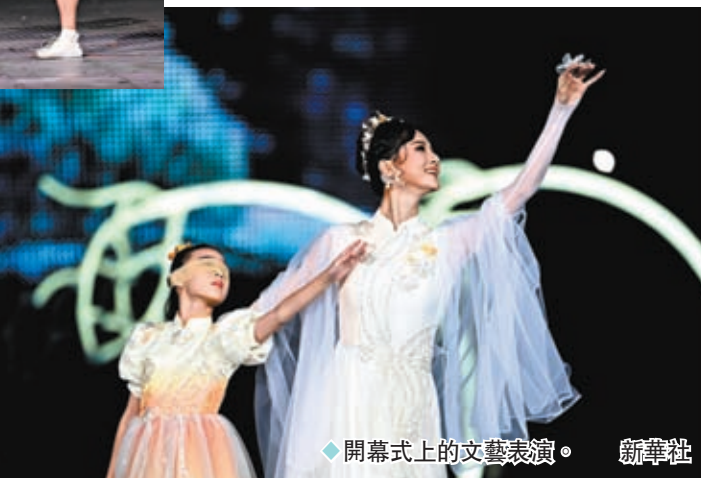
◆開幕式上的文藝表演。新華社