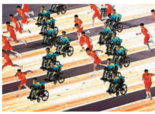
▲開幕式上表演輪椅舞。