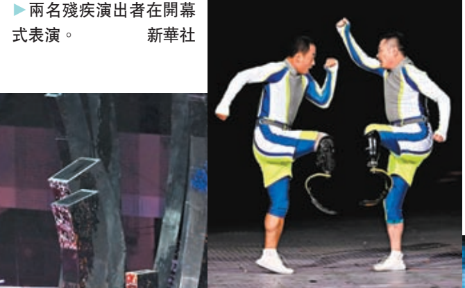
▶兩名殘疾演出者在開幕式表演。