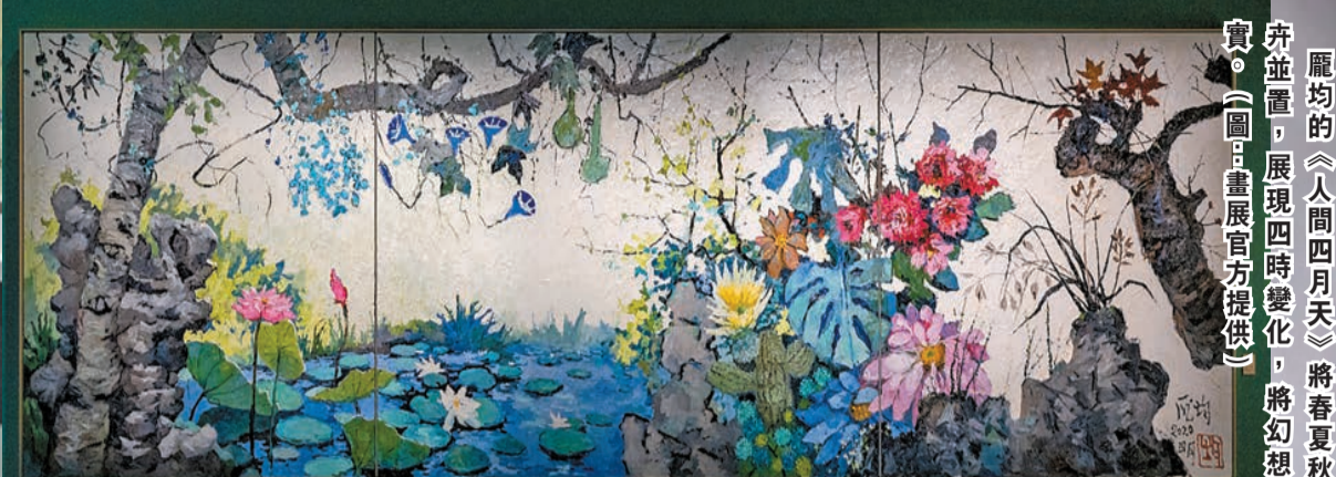
龐均的《人間四月天》將春夏秋冬的花卉並置，展現四時變化，將幻想融入現實。