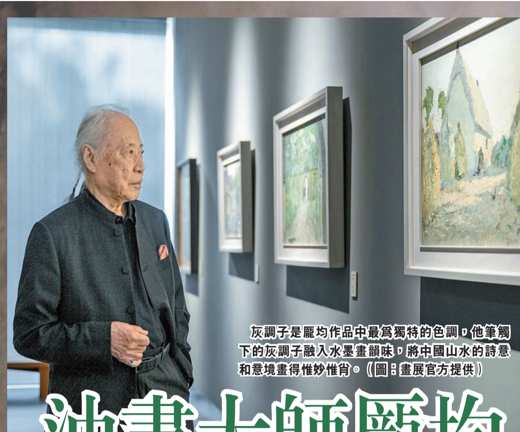
灰調子是龐均作品中最為獨特的色調，他筆下的灰調子融入水墨畫韻味，將中國山水的詩意和意境畫得惟妙惟肖。

龐均被譽為「東方人文表現主義」大師，成長於文藝世家，師從於徐悲鴻、林風眠等藝術大家，自小對藝術有獨特的見解。執筆七十六載，從不忘藝術初心，龐均再度回到香港這個於他而言別具意義的城市，舉辦個人油畫展，展出近年創作的39幅新作及9幅繪於上世紀七十年代的作品，以獨具個人風格的色彩和意境，向大眾呈現自然萬物的詩意韻律之美。