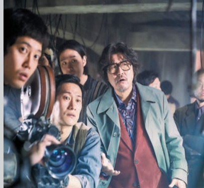
一眾演員圍困片場，為的是要幫忙導演重拍結局。

1970年代著名金導演（宋康昊飾）剛完成最新作品《蜘蛛窩裏的風波》，他期望拍出一部曠世神作，但卻被結局深深困擾，驚覺必須重拍結局，才能一洗污名。整個製作團隊在半推半就的情況下擠出兩天拍攝檔期重拍。一齣傑作背後，總在無數令人哭笑不得的惡劣條件下誕生！一眾演員經過兩天在「廝殺片場」禁室趕拍，是否就能換來一部驚世鉅作？