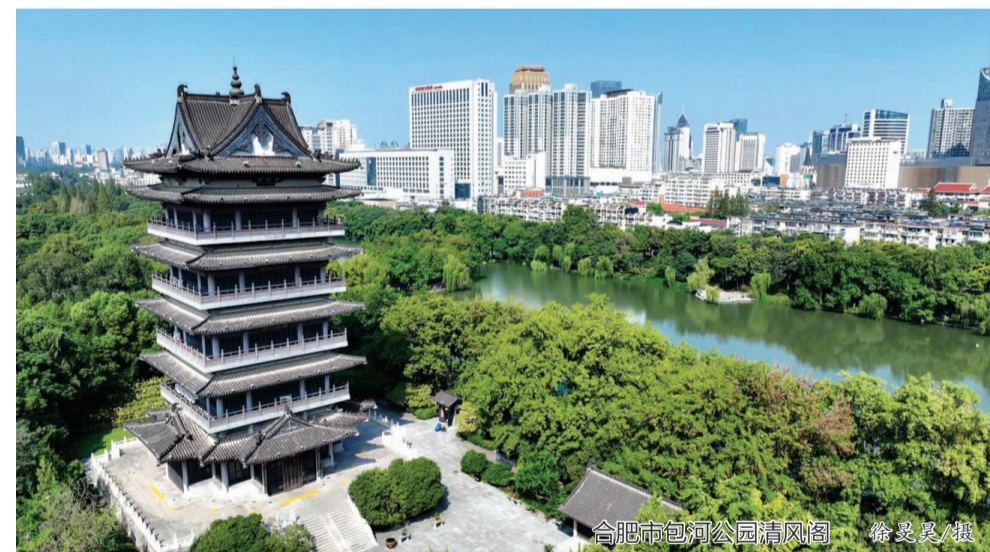
合肥市包河公园清风阁

至元代,统治者的高压政策下,杂剧作家们只能借古喻今,用历史题材反映人们的苦难、表达百姓的愿望,包公这样为民请命的清官,由此频频出现在戏剧舞台上。据统计,在现存的一百多种明代杂剧中,包公戏就有十多种,比如关汉卿的《包待制三勘蝴蝶梦》、郑廷玉的《包龙图勘后庭花》、李行道的《包待制智勘灰阑记》等。