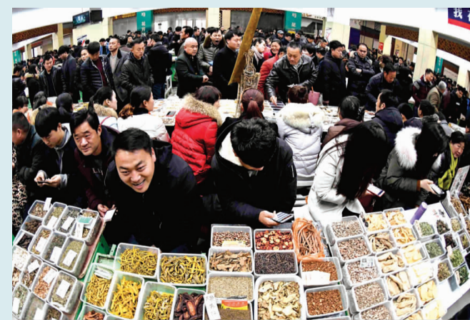
亳州中药材专业市场交易繁忙