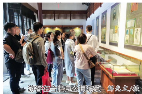
游客在合肥包公祠游览