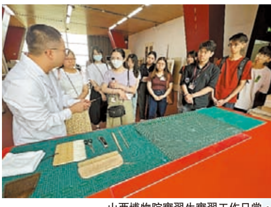
山西博物院實習生實習工作日常。

【香港商報訊】記者呂明霞報導：9月17日，香港山西商會在香港舉行了「晉港青年匯 山西機遇行」內地實習計劃2023總結分享會。在胡曉明創會會長、立法會吳傑莊、鄧飛議員等嘉賓、籌委會成員、大專院校老師的見證下，實習同學分享了他們在山西實習的所見所聞所感。「晉港青年匯 山西機遇行」內地實習計劃2023為疫情後首次舉辦。今年4月政府恢復舉辦內地實習計劃後，商會第一時間組建了以吳騰會長為召集人的籌委會，開啓緊張的宣傳和招募工作，經過面試，最後選拔出27位香港青年組成了實習團。