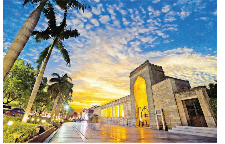
5月17日, 泉州清净寺位于福建泉州古城区中心, 散发着浓郁的异域风情。

2009年, 由已故阿曼苏丹卡布斯·本·赛义德出资50万美元捐建的新礼拜堂于清净寺东侧落成, 成为中阿两国人民友