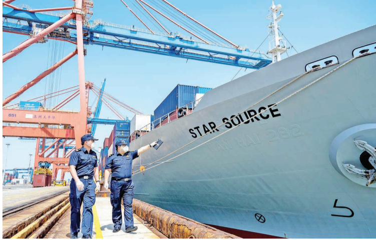
5月25日, 海关关员在福建泉州石狮石湖港对班轮进行巡查, 随后泉州首条中东西外贸集装箱航线开通。