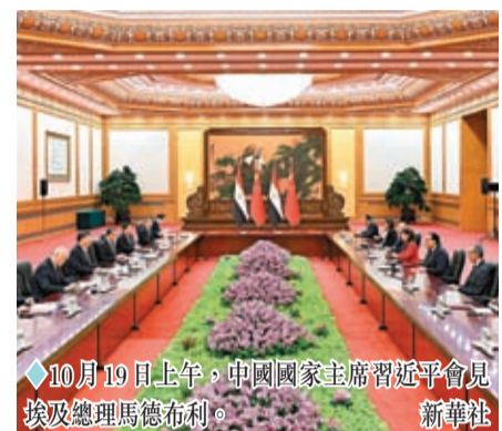
10月19日上午，中國國家主席習近平會見埃及總理馬德布利。

香港文匯報訊 據新華社報道，10月19日上午，中國國家主席習近平在人民大會堂會見來華出席第三屆「一帶一路」國際合作高峰論壇的埃及總理馬德布利。