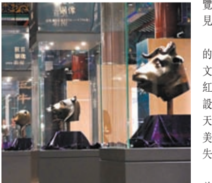
十二獸首之牛首、虎首、猴首、豬首時隔163年後首次與馬首重聚圓明園，亮相特別展覽。

香港文匯報訊 據央視新聞客戶端報道，10月18日，由保利藝術博物館收藏的圓明園十二獸首之牛首、虎首、猴首、豬首，在時