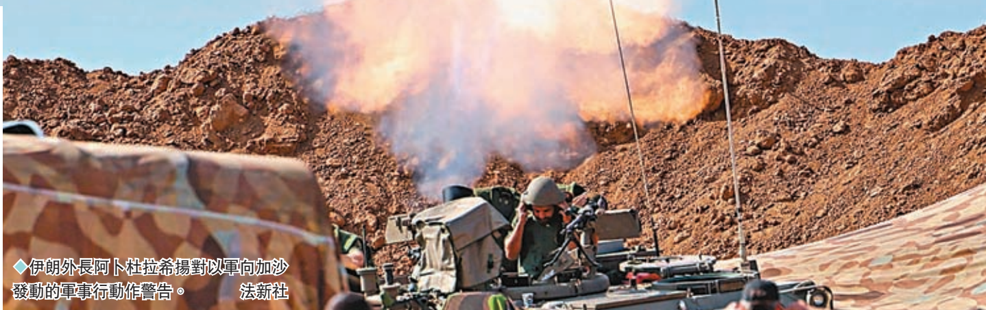
伊朗外長阿卜杜拉希揚對以軍向加沙發動的軍事行動作警告。

香港文匯報訊 巴以衝突外溢風險引起多國關注。伊朗外長阿卜杜拉希揚周一(10月16日)警告，若以色列持續在加沙地帶為所欲為，「由中東地區反西方國家或反以色列的武裝組織組成的抵抗陣線，或會先發制人」，暗示或會加入戰事。美國總統拜登則宣布於18日訪問以色列，分析認為拜登今次出訪，相信旨在重申對以色列的支持，但其政治和安全風險都難以衡量。