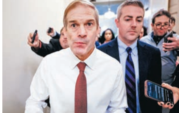
喬丹(左)或從極右非主流躍居至美國第三把交椅。

《紐約時報》指出，若59歲的喬丹能當選眾院議長，他將一舉從黨內極右翼的非主流，躍居至美國的第三把交椅。