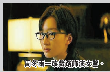
周冬雨一改戲路飾演女警。