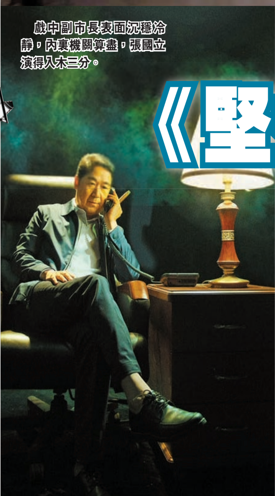
戲中副市長表面沉穩冷靜，內裏機關算盡，張國立演得入木三分。