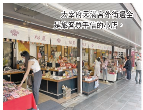
太宰府天滿宮外街邊全是旅客買手信的小店。

天滿宮落成於公元919年，因破舊，現時正在修繕，預計要三年後才修好，但在原來的天滿宮前面，已建好一個臨時的本殿供遊人參拜。這個本殿外觀讓人眼前一亮，就是一個簡單的屋頂，下有柱子撐起，但屋頂上卻種滿了植物。著名建築師藤本壯介，為了使這個臨時本殿和天滿宮四周的自然風景融為一體，大膽採用了以森林為屋頂的設計，讓人看後為之叫絕。