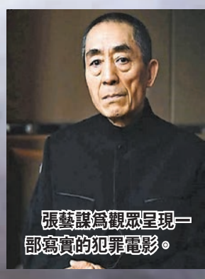
張藝謀為觀眾呈現一部寫實的犯罪電影。