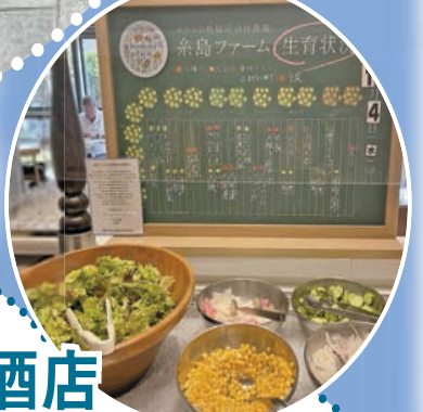
筆者下榻的福岡Nikko酒店，房間寬大舒適。

現時旅客出遊多數選擇自由行。筆者這次遊日本就選用booking.com的APP預訂機票與酒店住宿，只需二十分鐘已安排好一切。人們頻繁出遊，但發現時的酒店越來越不環保，例如每天換毛巾、使用即棄牙刷等。全世界的環保意識漸提高，近年可持續旅行成為旅遊業的新趨勢，根據Booking.com發布的2023年可持續旅行報告，當中有近68%受訪者表示希望在未來一年內以更可持續的方式旅遊，包括64%受訪者會使用可重用的購物袋、55%受訪者會回收廢物以及56%受訪者攜帶可重用的水樽等。筆者這次在APP上選酒店，就看見有環保標示的酒店，在住宿時可考慮酒店的環保標示，包括太陽能設備、設有可持續水務管理系統、提供有機食物的選擇等。個人認為在網站上選擇取得可持續旅遊認證徽章的酒店，是支持可持續旅行的重要一步。