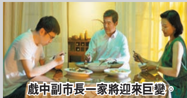
戲中副市長一家將迎來巨變。