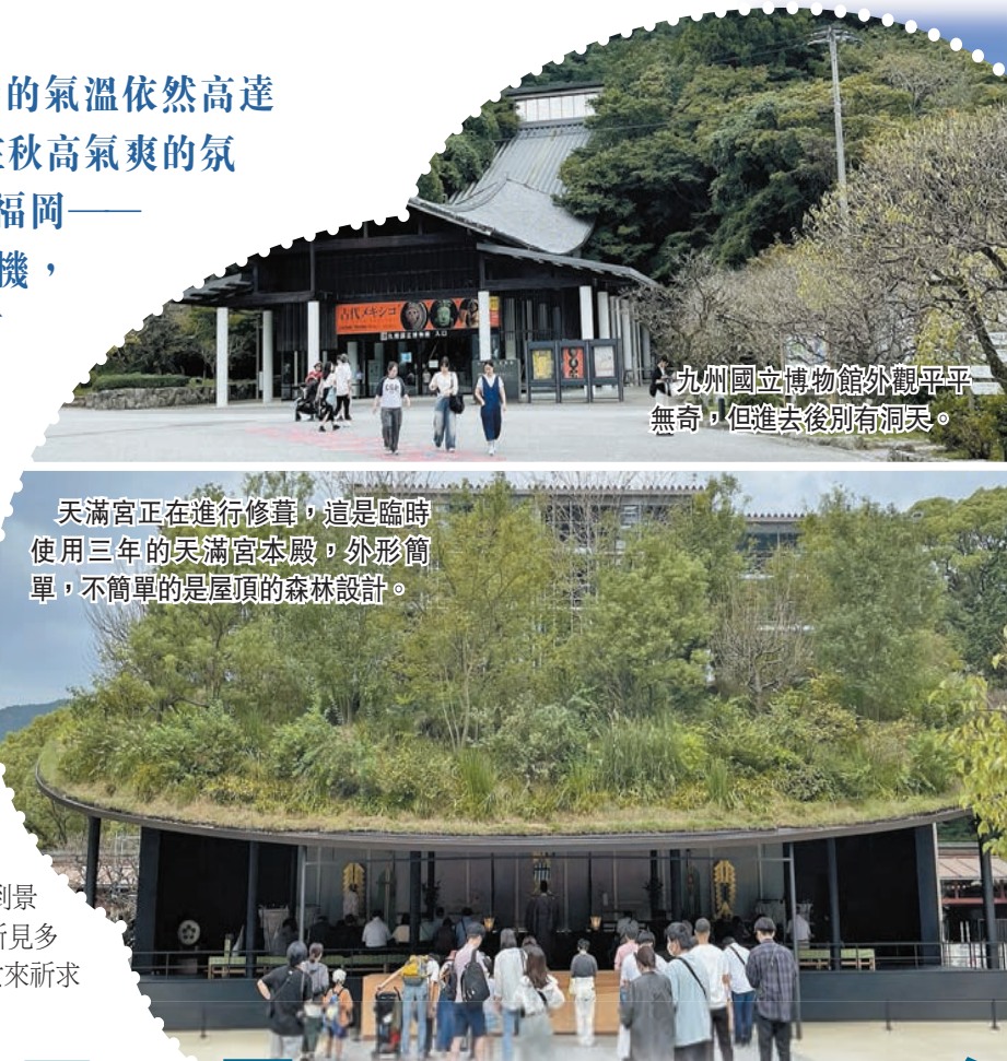
九州國立博物館外觀平平無奇，但進去後別有洞天。

遊福岡，除了市內的景點外，值得一去的還有太宰府。太宰府位於福岡市東南方約16公里，擁有多項歷史遺蹟，包括著名的觀光景點太宰府天滿宮。而更值得去的，還有九州國立博物館，這個博物館就在太宰府景區內。遊太宰府（DAZAIFU）可以即日來回，早上在市中心的博多（HAKATA）巴士總站乘坐大巴到太宰府，從總站到總站，全長約40分鐘，方便快捷，然後直接進入太宰府旅遊景區。太宰府天滿宮景致迷人，一年四季遊客不斷。進到景區，主角當然是天滿宮。筆者遊覽當天，天滿宮遊人如鯽，所見多是日本當地遊客，因為天滿宮祈求的是文昌，父母都帶着子女來祈求學業成績理想，外國遊客則多是內地人和香港人。