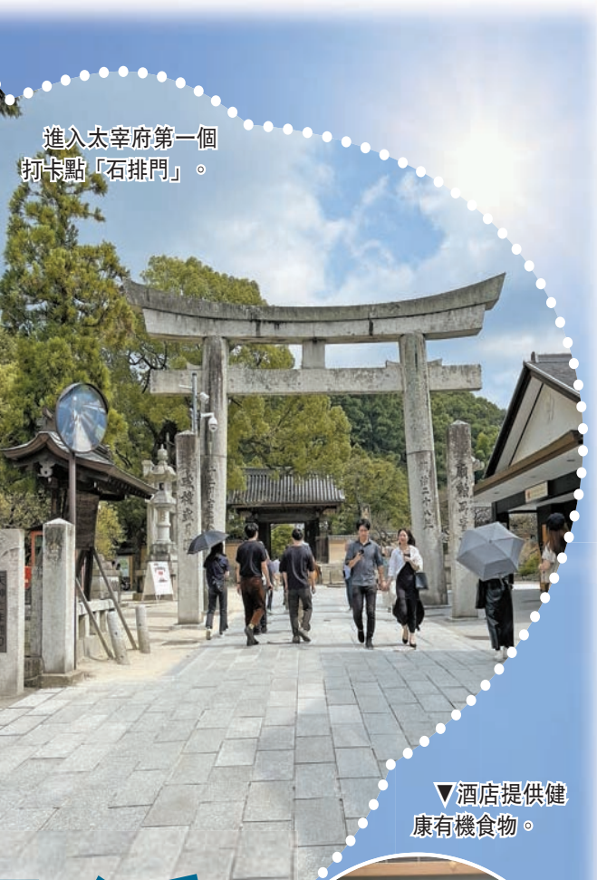
進入太宰府第一個打卡點「石排門」。

天滿宮正在進行修葺，這是臨時使用三年的天滿宮本殿，外形簡單，不簡單的是屋頂的森林設計。