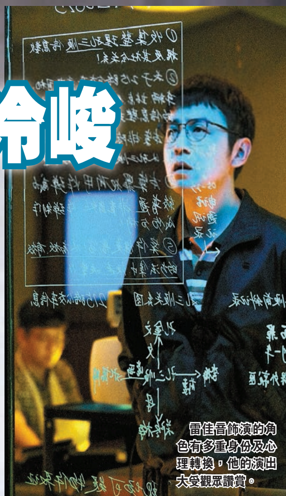
雷佳音飾演的角色有多重身份及心理轉換，他的演出大受觀眾讚賞。

繼《山楂樹之戀》後再度與張藝謀合作的周冬雨，一改少女形象，飾演具查案直覺的女警，在一場持槍與匪徒對峙的場景中，盡顯凌厲氣勢。飾演副市長夫人的陳沖對白極少，全憑表情、動作演繹出角色內心隱忍矛盾的複雜情感，是劇情推進的重要人物。在戲中雷佳音的角色兼具養子、警察、上司、下屬等多重身份，他在轉換身份時揮灑自如的演技，連導演也稱讚他是「不可低估的演員」。