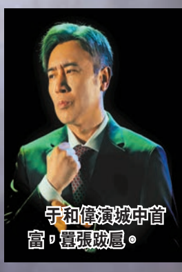
于和偉演城中首富，權張跋扈。