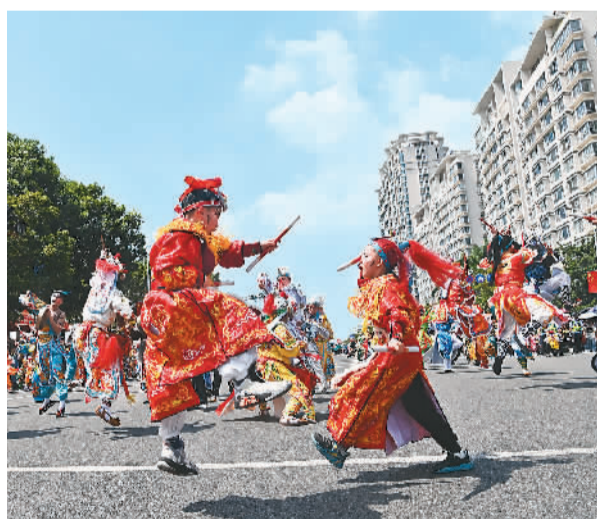
图为小演员在2023年汕头市国庆巡游活动中表演英歌舞对打。

近日，来自泰国的300多名青少年来到广东汕头，学中文、访高校、逛景点、感受非遗文化，开启了一趟特别的寻根之旅。