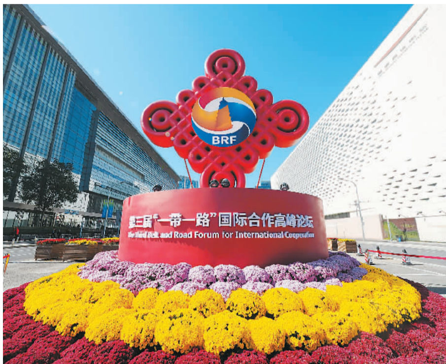
图为近日，北京国家会议中心附近，中国结造型的“一带一路”国际合作高峰论坛雕塑格外美丽。

硕果。在这幅动人的“工笔画”中，海外侨胞发挥自身优势，积极贡献力量，增添了一抹抹动人色彩。