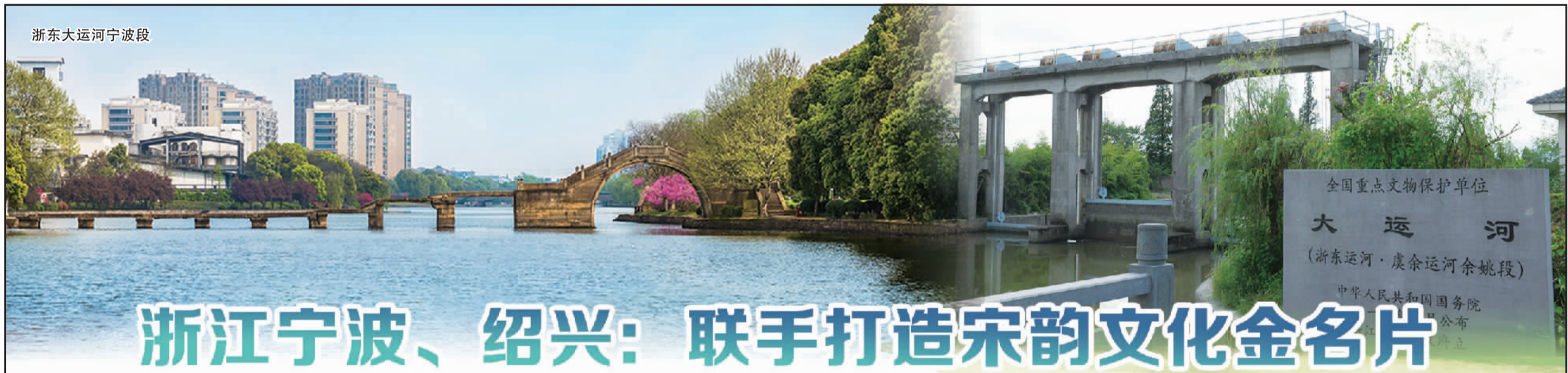
浙东大运河宁波段

与会专家表示，未来智慧城市需要不断改进数字化治理，这将为智慧城市高质量发展持续赋能。