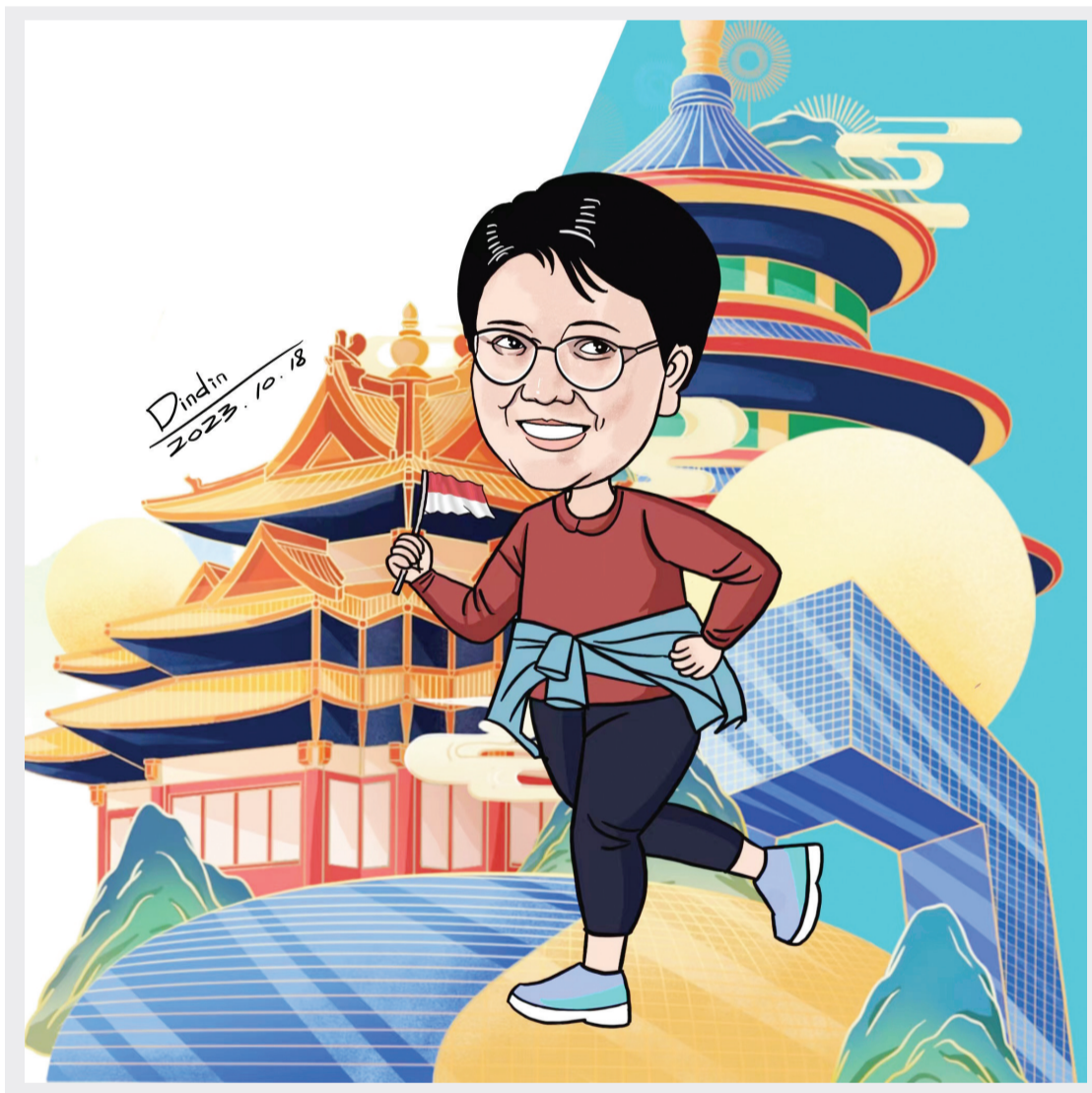
漫点南洋 (本报原创漫画)