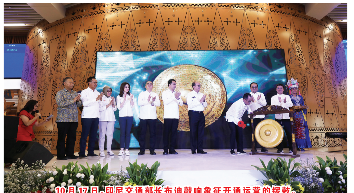
10月17日，印尼交通部长布迪敲响象征开通运营的锣鼓。