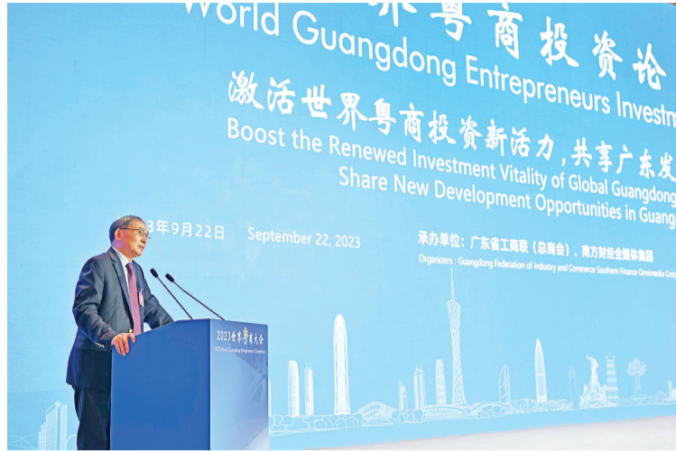
9月22日,2023世界粤商大会在广东省广州市开幕,香港中文大学(深圳)教授、前海国际事务研究院院长郑永年在大会主论坛上作主旨发言。