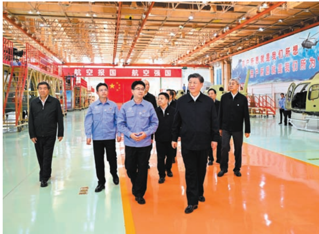
◆10月11日，習近平總書記來到昌河飛機工業（集團）有限公司，了解企業技術創新情況。這是習近平在昌河飛機工業（集團）有限公司考察。