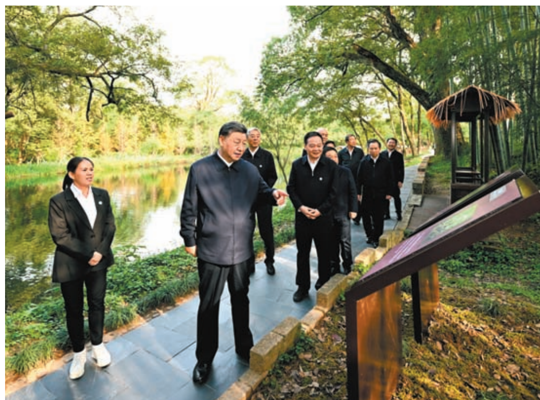
◆10月11日，習近平總書記來到上饒市婺源縣秋口鎮王村石門自然村，了解濕地公園生態保護、推進鄉村振興等情況。這是習近平在上饒市婺源縣秋口鎮王村石門自然村考察。